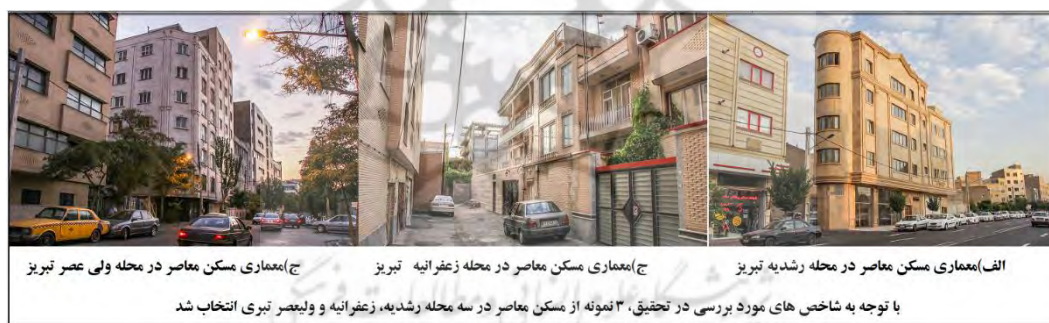
شکل ۲- نمونه هایی از معماری مسکن معاصر با توجه به شاخص های تحقیق در سه محله رشدیه، زعفرانیه و ولیعصر تبریز یافته های تحقیق

رویکرد غالب مورد استفاده در تحقیق حاضر، رتبه بندی تیپولوژی محله های (ولی عصر، زعفرانیه و رشدیه) شهر تبریز با توجه به فاکتورهای معماری، طراحی و برنامه ریزی اقلیمی در ساخت مسکن می باشد. در این تحقیق محله های مورد مطالعه ی شهر تبریز بر اساس معیارهای (کیفی) رتبه بندی می شوند.