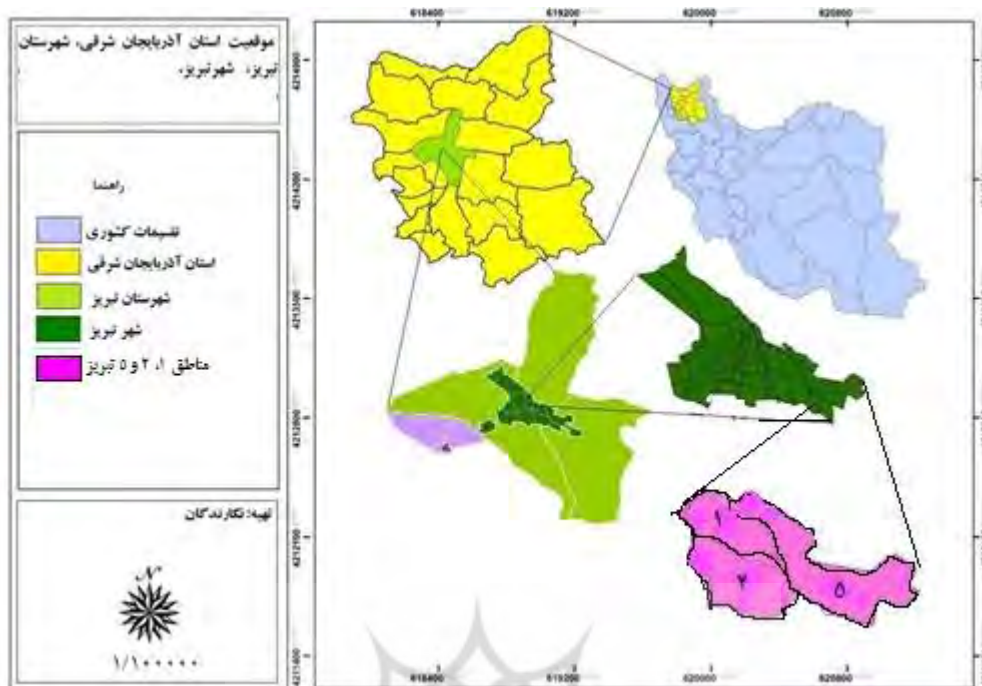
شکل ۱- نقشه موقعیت استان آذربایجان شرقی، شهرستان تبریز، شهر تبریز و مناطق مورد مطالعه (یافته های تحقیق: نگارندگان؛ ۱۳۹۹)