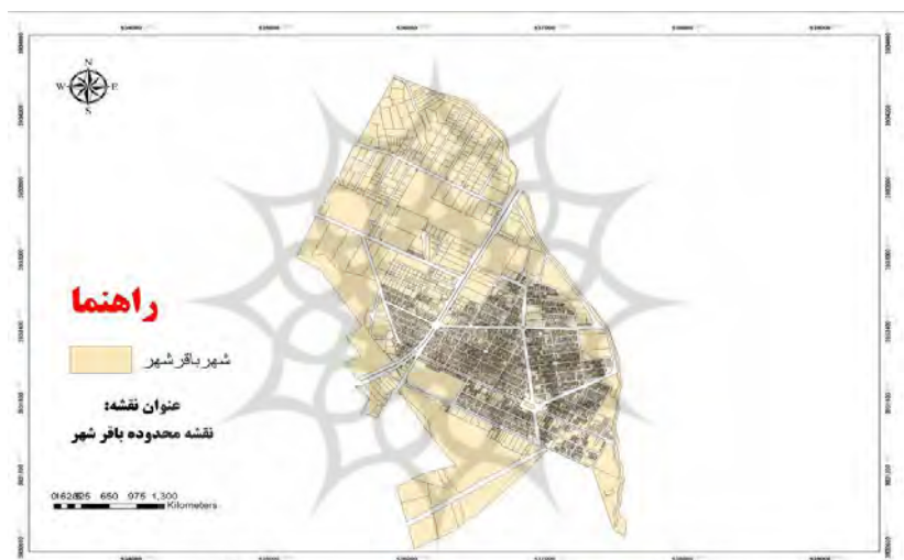
نقشه شماره ۱: تقسیمات سیاسی باقر شهر

بافت های فرسوده باقرشهر و نوع ساخت این شهر از جمله مباحث اصلی در برنامه ریزی های مدیریت بحران و مدیریت شهری است. علاوه بر تمام مواردی که به اختصار در خصوص باقرشهر عنوان شد، بافت های فرسوده و بناهای غیر اصولی در این شهر که به دلیل ساخته شدن بناها با مصالح مستعمل و بدون مجوز ساخت هستند اغلب دارای شرایط ایمنی ساخت و ساز نیستند و بنا به مشاهدات عینی حتی با بادهای تند، برخی دیوارهای ابنیه فروریختند! در چنین وضعیتی بدیهی است با لرزش های کوچک گسل یا بادهای شدید ساختمانها و به طبع آن شهروندان دچار مشکل می شوند و در مسایل طبیعی کوچک بحران های بزرگ شهری را تجربه می کنند که قطعا با وضعیت شهرسازی این شهر، تبعات و آسیب های انسانی همچون مرگ و میر و خسارت مالی بالایی را تجربه می کنند بحران ها یک یا چند عامل و عنصر بنیادی را هدف قرار می دهند ضرورتا می توانند دگرگونی های عمده ای در سیستم شهری به وجود آورند شدت و ضعف این دگرگونی ها بستگی به عوامل تشدید کننده یا عناصر پنهانی بحران و تکنیک های موجود برای مدیریت و مهار بحران ها دارد (نگارنده، ۱۳۹۹)