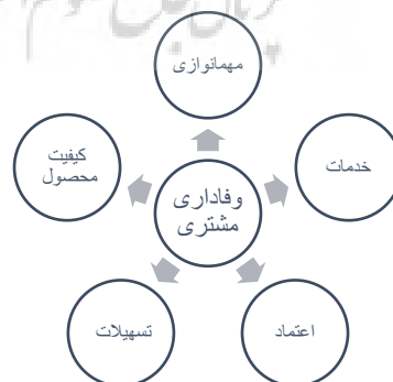
شکل (۲): مدل کیفی پژوهش؛ الگوی وفاداری مشتری در صنعت هتلینگ با رویکرد ورزشی