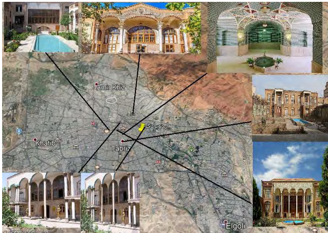
شکل ۲- محدوده شهر تبریز