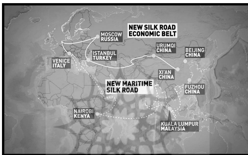
شکل ۲: کمربند اقتصادی جاده ابریشم جدید

در سال‌های اخیر، ایده جاده ابریشم مجدداً احیا شده و اندیشمندان غربی و شرقی طرح‌هایی را برای راه‌اندازی مجدد و گسترش آن ارائه داده‌اند. دو طرح ارائه شده در خصوص جاده ابریشم جدید عبارتند از: «طرح جاده ابریشم آمریکا» که در سال ۲۰۱۱ توسط هیلاری کلینتون مطرح شد و دیگری «طرح جاده ابریشم چین» که شی جی پینگ طی یک سخنرانی در دانشگاه نظربایف قزاقستان در هفتم سپتامبر ۲۰۱۳ مطرح کرد (ملکی و رثوفی، ۱۳۹۵:ص ۲۷-۲۵).