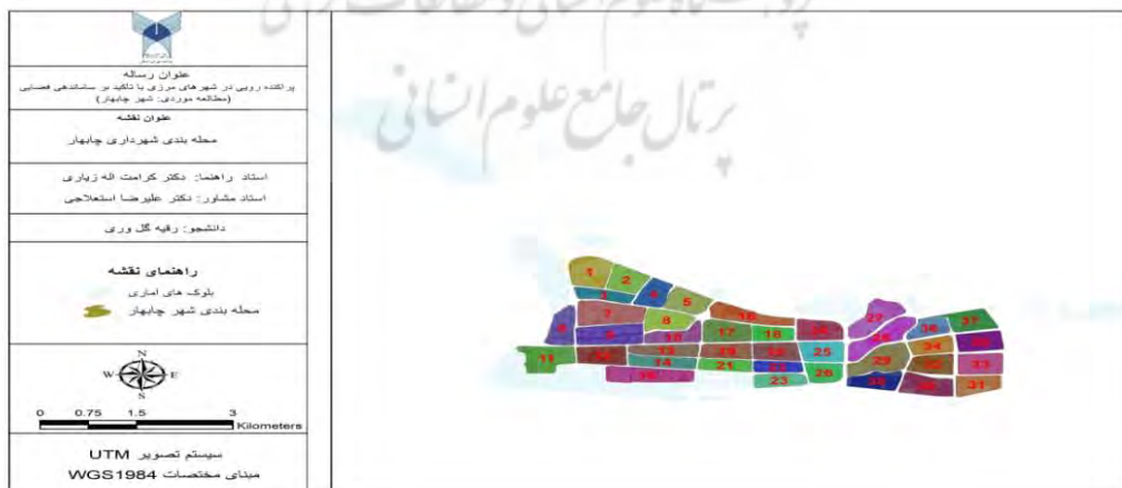
شکل ۲ وضعیت موجود شهر چابهار

با بررسی وضعیت موجود ساماندهی فضایی شهر چابهار، می توان میزان پراکنش جمعیت در سطح محلات، تعداد خانوار، میزان مساحت تخصیص یافته به آن ها را مورد ارزیابی قرار دارد؛ بنابراین وضعیت موجود شهر چابهار در شکل شماره (۲) نشان داده شده است.