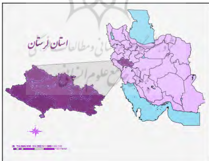
شکل ۱. موقعیت استان لرستان در کشور

استان لرستان با وجود داشتن مناطق ممتاز گردشگری مانند قلعه فلک الافلاک، دریاچه گهر، آبشارهای زیبا، تاریخ کهن، میراث فرهنگی کم نظیر، موقعیت استراتژیک و فرصت‌های متعدد پیشرو همچون افزایش انگیزه مسافرت در بین مردم، وجود نیروهای متخصص و شرایط اقلیمی و طبیعی مناسب با ضعف‌ها و تهدیدهایی در استفاده از توانمندی‌های موجود در این زمینه مواجه است. استان لرستان دارای جاذبه‌های طبیعی چون جاذبه‌های طبیعی (رودها: کشکان، سیمره، سزار، دریاچه‌های گهر، کیو، غارها، کوه‌ها، تالاب‌ها، آبشارها و پوشش گیاهی متنوع) می‌باشد. علاوه بر جاذبه‌های طبیعی گسترده، این استان از لحاظ تاریخی و باستانی غنی می‌باشد. بطوری که طبق آمارهای رسمی منتشره مجموع مکان‌های باستانی و زیارتی استان ۱۱۱ مورد است که شامل ۵۲ زیارتگاه، ۴ مسجد، یک سنگ نوشته، ۶۷ قلعه، ۲۱ اشکافت و غار، ۲۴ پل، ۲ مناره، ۹۱۲ محوطه و تپه باستانی، ۱۰ خانه قدیمی، ۱۳ آرامگاه، ۳ کاروانسرا و ۲ بازار می‌باشد، که تعدادی از آن‌ها شامل ۲۱ مکان در زمره آثار ملی به ثبت رسیده است (طرح جامع گردشگری استان لرستان، ۱۳۸۵).