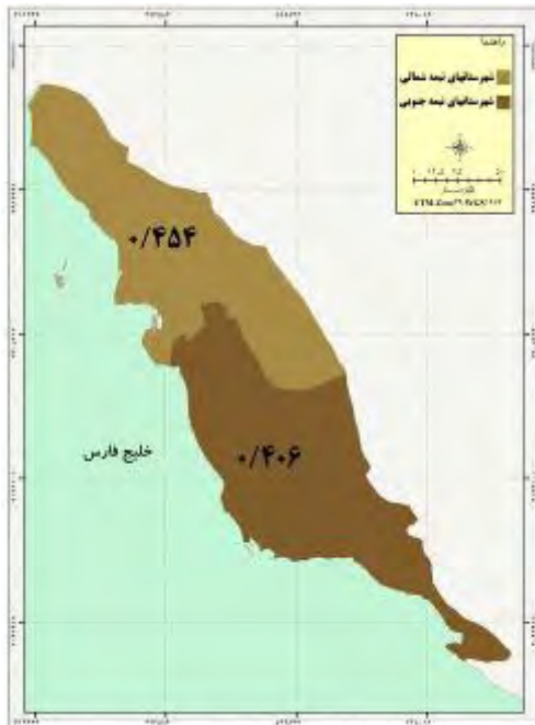
شکل ۸- توسعه روستایی نیمه شمالی و جنوبی استان در شاخص خدماتی