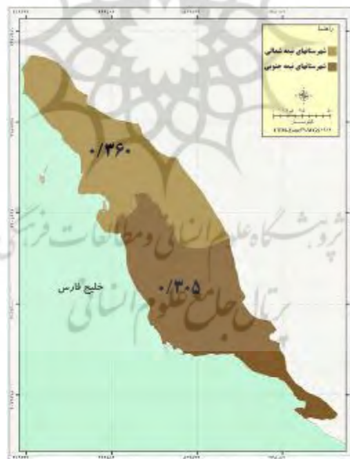
شکل ۹- توسعه روستایی نیمه شمالی و جنوبی استان در شاخص ارتباطی