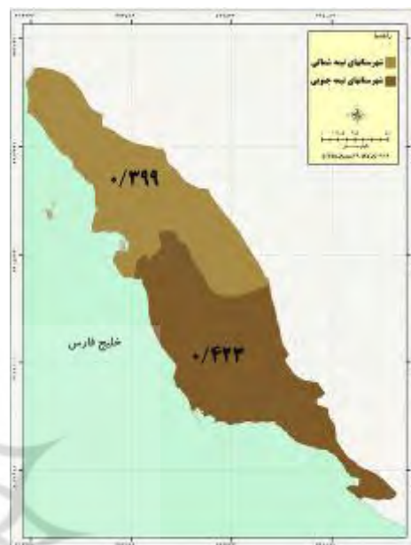
شکل ۳ - توسعه روستایی نیمه‌شمالی و جنوبی استان در شاخص زیربنایی