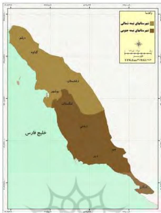
شکل ۲- نمایش شهرستان‌های استان بوشهر در قالب دو نیمه شمالی و جنوبی

جدول ۵- وضعیت توسعه روستایی شهرستان‌های نیمه‌شمالی و جنوبی استان در شاخص زیربنایی