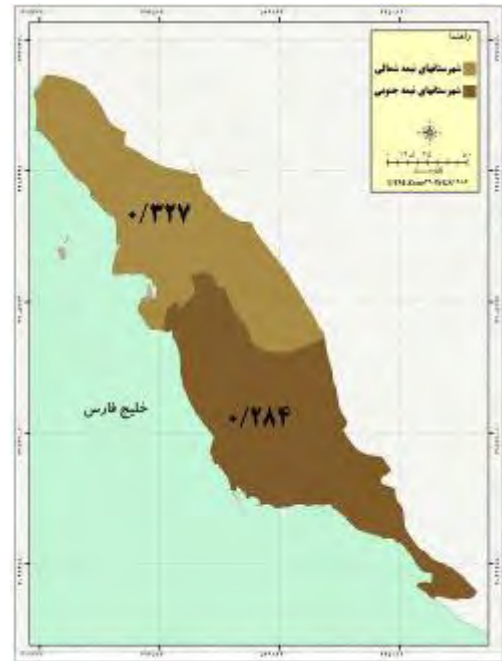
شکل ۷- توسعه روستایی نیمه شمالی و جنوبی استان در شاخص بهداشتی