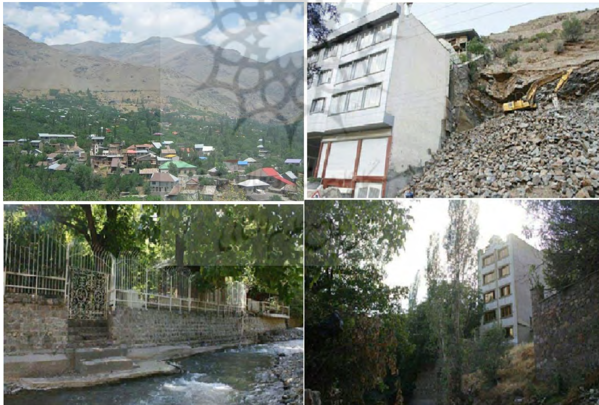
شکل ۳: تصاویر از وضعیت خانه‌های بومی؛ ویلا سازی و تجاوز به حریم رودخانه، باغ و کوه