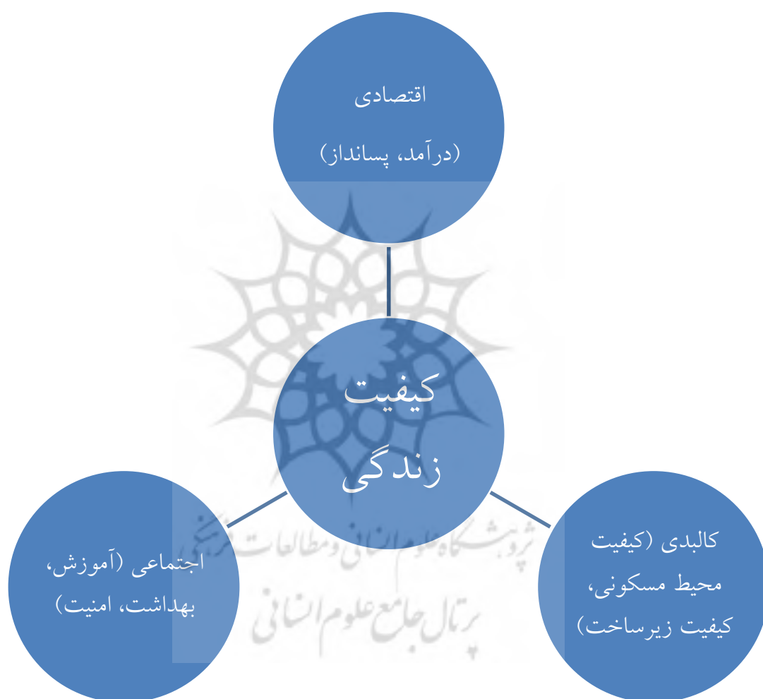
شکل 1: مدل مفهومی کیفیت زندگی

از شاخص‌های اجتماعی و ذهنی باهم، برای سیاست‌گذاران یک ارزیابی دقیق از کیفیت زندگی لازم است (Diener et al, 2006, 1997). به اعتقاد پال (2005)، کیفیت زندگی نشان‌دهنده ویژگی‌های کلی اجتماعی و اقتصادی و محیطی مناطق است و می‌تواند به عنوان ابزاری قدرتمند برای نظارت بر برنامه‌ریزی توسعه اجتماع به کار رود. لذا هدف غایی مطالعه کیفیت زندگی و کاربرد متعاقب آن، بدین منظور است که مردم توان بهره‌مندی از زندگی‌ای با کیفیت مطلوب را داشته باشند، به طوری که این زندگی علاوه بر هدفمندی لذت‌بخش هم باشد (Allen, Voget and Cordes, 2002, ). (14).