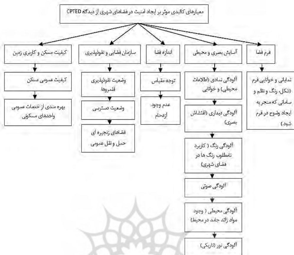
شکل ۱: معیارهای کالبدی مؤثر بر ایجاد امنیت در فضاهای شهری از دیدگاه رویکرد CPTED (Minnery et al, 2005 و صالحی، ۱۳۸۷)