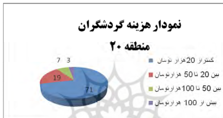
نمودار شماره ۱- مقایسه هزینه گردشگران در مناطق مورد مطالعه