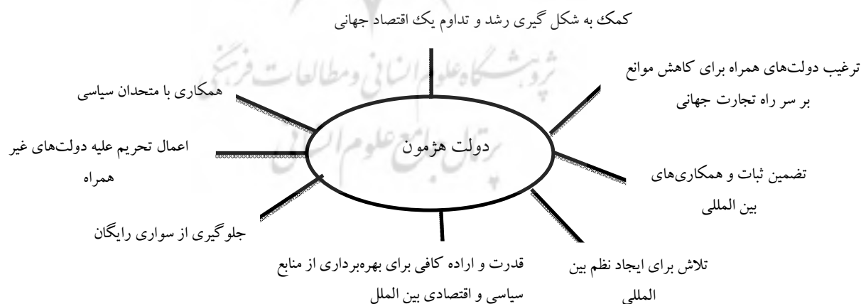
شکل ۱: نقش دولت هژمون در ساختار نوین نظام بین‌الملل از نگاه گیلین

با توجه به این مفروضات، این نظریه پردازان تصریح می‌کنند که ریشه‌های شکل‌گیری منازعات بین‌المللی در دوران پس از جنگ سرد، دچار یک چرخش اساسی از ایدئولوژی به رقابت بر سر تسخیر منابع طبیعی شده است (Nevins, 2004, pp 255 – 256). این پژوهش بر پایه نظریه واقع‌گرایی ساختاری و همچنین «ثبات مبتنی بر هژمونی» استوار است و این امری است که در این پژوهش به تبیین آن می‌پردازیم.