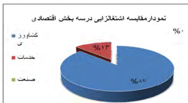
شکل ۴: مقایسه اشتغال ایجاد شده در سه بخش اقتصادی در دهستان میان جوین در سال ۱۳۸۹-۹۰

در این سه بخش اقتصادی، ۸۷/۰۷ درصد در بخش کشاورزی، ۱۲/۹۲ درصد در بخش خدمات فعالیت می کنند. بخش صنعت اشتغالی برای این دهستان ایجاد نکرده است. با مشاهده درصدها در سه بخش، اول: کشاورزی، دوم: خدمات و نهایتاً هم صنعت که صفر است، قرار می گیرد.