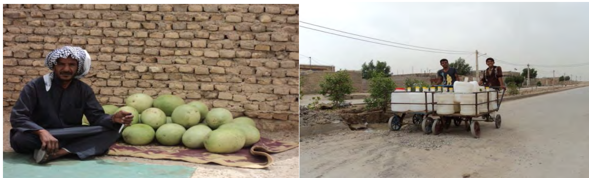
شکل ۵ و ۶: اشتغال در کوی سیاحی