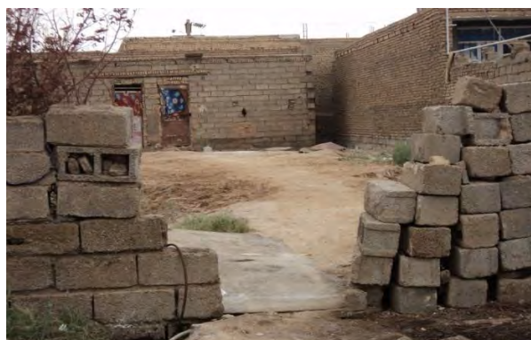
شکل ۷: نوع مصالح ساختمانی بکار رفته در منطقه