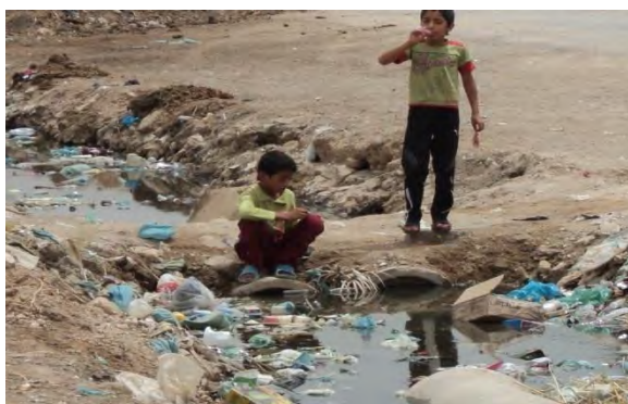
شکل ۸: نحوه دفع فاضلاب در منطقه