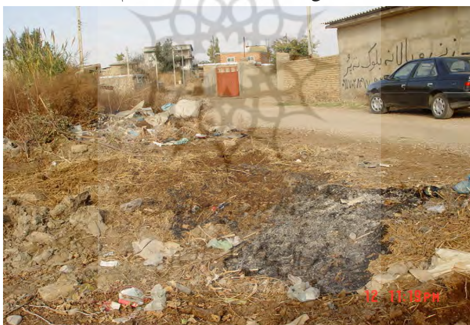
شکل ۳ - دفع نامناسب و سوزاندن زباله در محله غلام تپه