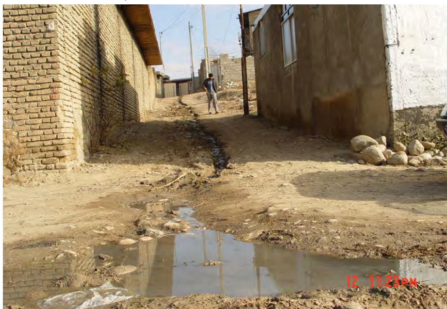
شکل ۲ - هدایت نامناسب فاضلاب در محله غلام تپه