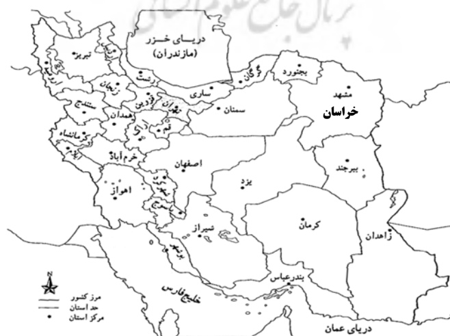
شکل شماره ۱- نقشه تقسیمات کشوری جمهوری اسلامی ایران به تفکیک استان

دهستان بالا ولایت به مرکزیت روستای قلعه بالا «فرح آباد» از توابع شهرستان کاشمر می‌باشد. دهستان بالا ولایت در شرق شهرستان کاشمر که حدود ۶۸۹ کیلومتر مربع مساحت دارد و با شهر کاشمر حدود ۹ کیلومتر فاصله دارد. این دهستان در طول جغرافیایی 26^{\circ} 58' تا 44^{\circ} 58' و عرض جغرافیایی 41^{\circ} 34' تا 56^{\circ} 34' واقع شده که از سمت شمال به بخش کوهسرخ و دهستان پایین ولایت و از غرب به شهرستان خلیل‌آباد و از سمت شرق به شهرستان مه ولات محدود می‌شود. «عفتی مقدم، رضا، سال ۱۳۸۴، ص ۱۷»