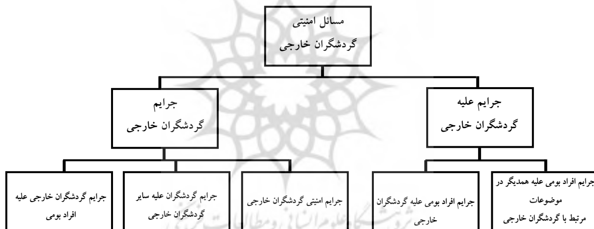
شکل شماره ۲: نمودار ابعاد مسائل امنیتی گردشگران خارجی

۲- جنایات‌های سازمان یافته سیاسی: معمولاً گردشگران خارجی هدف تحرکات سیاسی قرار می‌گیرند، گاهی آنان را می‌ربایند و گاهی نیز آنها را ترور می‌کنند. گروه‌های تروریستی سعی می‌کنند با جنایت علیه گردشگران خارجی توجه عموم را به اهداف خود جلب نمایند. (داس ویل، ۱۳۷۹: ۲۲۸)