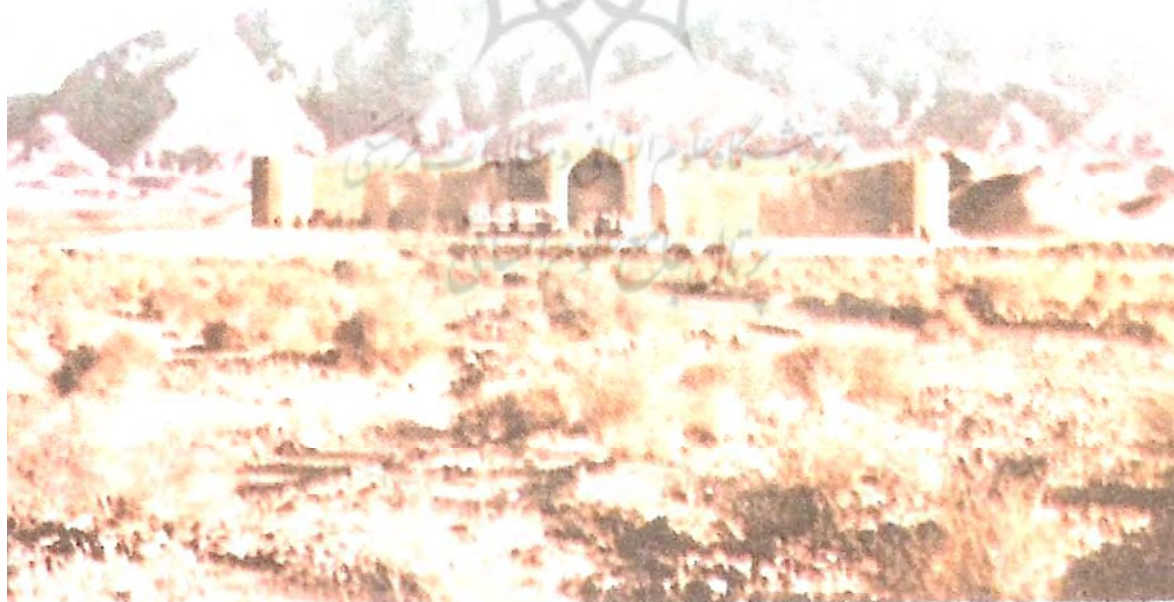
نمای شمالی کاروانسرای شاه عباسی که سرشکاربانی پارک ملی کویر در آن

این ساختمان برعکس نامش کاروانسرا نبوده و به طوری که مطلعیم می‌گویند ساختمان شکاری سلاطین صفوی بوده است. وجود شاه نشین در ضلع غربی و آبراه سنگی برای انتقال آب از چشمه شاهی سیاه کوه به این قصر و نیز دو کاروانسرای دیگر که به عنوان حرمخانه و احتمالاً قوشخانه و محل اقامت رعایا مورد استفاده قرار می‌گرفته گواه بر این مدعی است که این ساختمان مخصوص مسافرت‌های شکار پادشاهان صفوی بوده است. ساختمان مذکور هم اکنون به عنوان میهمانسرا پاسگاه شکاربانی در پارک ملی کویر مورد بهره‌برداری قرار می‌گیرد.