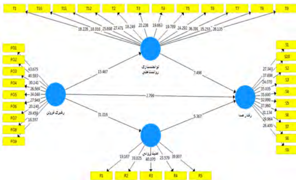
شکل ۲. اجرای مدل در حالت اعداد معناداری