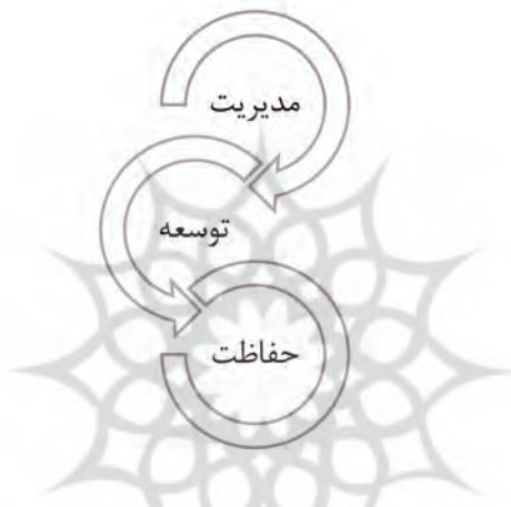
شکل ۷. توجه همزمان به عوامل تاثیرگذار در طراحی منظر