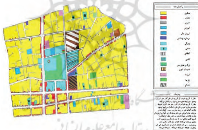
شکل ۸. کاربری پیشنهادی محوطه تاریخی برج قابوس

برای ساماندهی منظر فرهنگی- طبیعی این محوطه تاریخی به منظور احیا و توسعه پایدار گردشگری ملزم به ساماندهی و تجهیز این محوطه تاریخی به یک محوطه مناسب گردشگری بدون خدشه‌دار کردن منظر تاریخی- طبیعی برج قابوس (نظیر، طراحی سردر ورودی، ایجاد بازارچه صنایع دستی و ساماندهی فضاهای قدیمی) هستیم. برای ساماندهی فضاهای اطراف این محوطه و دادن کاربری‌های موردنیاز این مجموعه ابتدا باید فضاهای مورد نیاز را برای این محوطه تعریف کرد. با توجه به نقشه کاربری وضع موجود و بررسی محوطه‌های تاریخی گردشگری فضاهای زیر را برای این محوطه پیشنهاد