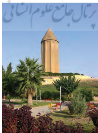
شکل ۴. پارک قابوس، (مأخذ: نگارندگان)

شاید کمتر کسی از مردم ایران می‌دانند که این برج در یک نظرسنجی بین‌المللی از سوی شماری از معماران مشهور جهان، به عنوان بهترین اثر مهندسی تاریخ بشر انتخاب شده است. دلایل انتخاب این برج، ارتفاع بیش از ۵۰ متر آن، قدمت بیش از هزار ساله آن و ایستایی در مقابل دو زلزله شدیدتر از ۶ ریشتر در طول حیاتش، و سالم، استوار و پابرجا بودن آن تا زمان معاصر بوده است. برج گنبد فقط از آجر ساخته شده و اثری از بتون آرمه و اسکلت فلزی و فولاد در آن نیست؛ در حالی که نه فرسوده شده و نه زلزله توانسته حتی یک ترک به آن بیندازد. محاسبات مهندس سازنده برج آن قدر دقیق بوده است که برج توانسته حتی در شدیدترین زلزله هم پس از لرزه‌ها و تکان‌های معمول دوباره دقیقاً سر جای خود برگردد. همچنین دقت در برآورد مقاومت مصالح آن نیز حتی افزون‌تر از محاسباتی است که هم اکنون پیچیده‌ترین دستگاه‌های محاسبه انجام می‌دهند (معطوفی، ۱۳۹۰، ۶۸-۷۳).