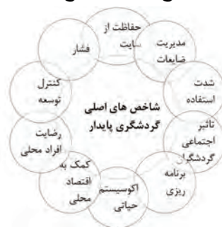
شکل ۲. شاخص‌های اصلی گردشگری پایدار (مأخذ: wto, 1993)

در سند گردشگری، توسعه گردشگری پایدار با توجه به اصول حفاظتی و افزایش فرصت‌های بهره‌برداری نسل‌های آینده، به برطرف کردن نیازهای نسل حاضر گردشگران میزبان می‌پردازد (شکل ۲). توجه به مراتب گوناگون مداخلاتی با هدف حفاظت از منظر نیز در جدول ۱ نمایش داده شده است. مراحل تشریح شده، در نمونه مورد برج قابوس تشریح خواهند شد.