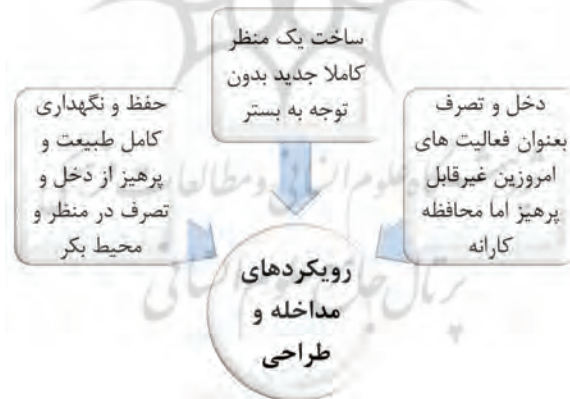
شکل ۶. رویکردهای مداخله و طراحی، (مأخذ: نگارندگان)

منظر در طول تاریخ دچار تغییرات بسیاری شده است که این مساله در قالب توالی منظر هم در بستر زمان و هم به وسیله ساکنین محلی (که آن نیز جدای از زمان نیست) امری موجه است. از طرفی همچنین عدم امکان و نیاز به بازگشت کامل این منظر به شرایط تاریخی به واسطه تغییر کاربری اراضی، مالکیت و محدودیت‌های اقتصادی، بازگرداندن کامل این منظر به روزگار تاریخی آن طبق سنت مرمت‌گران آثار تاریخی کاری عبث و بی‌مورد است، چرا که طبق نکات پیش گفته، اساساً منظر با توجه به پویایی و زنده بودنش مقوله‌ای متفاوت از سایر ارزشمند تاریخی است. از سوی دیگر هنوز موارد مهم و دارای ارزشی، درون این منظر از گذشته تاریخی آن موجود است که نمی‌توان آنها