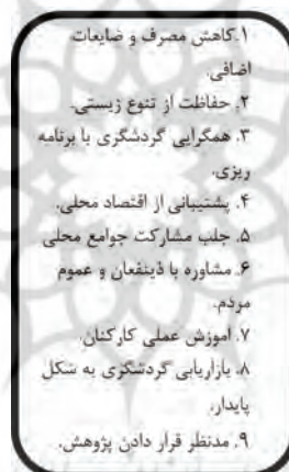
شکل ۱. اهداف و خطوط راهنمای گردشگری پایدار

توسعه پایدار گردشگری در تعریف سازمان جهانی گردشگری، استفاده بهینه از منابع موجود طبیعی و فرهنگی کشور است به در جهت تامین نیازهای نسل کنونی و آینده مرتبط می‌داند؛ تا ضمن حفظ یکپارچگی و هویت فرهنگی، سلامت محیط زیست و برقراری توازن اقتصادی، بتوان رفاه و آسایش ساکنان کشور و میهمانان آنان به طور متوازن و پیوسته در حد بهینه را تامین نمود (مهديزاده، ۱۳۷۹، ۱۳). گردشگری پایدار از این توانایی بالقوه برخوردار است تا با استفاده از انواع منابع طبیعی، فرهنگی، اقتصادی بدون اعمال اثرات زیانبار محیطی مطرح گردد، و در عین حال یک برنامه‌ریزی دقیق گردشگری لازم است که توسعه پایدار را عملی کرده و به اجرا درآورد (شکل ۱).