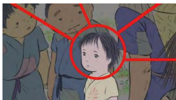
تصویر ۱۱. صحنه میهوت شدن کاگویا در رویارویی با طبیعت به‌عنوان بخشی از طبیعت در کودکی.