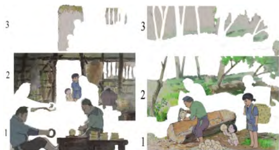
تصویر ۷. قرارگیری شخصیت‌های بیانگر مشاغل روستایی در پلان اول انیمه.

«کاگویا» برای ارائه به مخاطب امروزی از مانگاها نیز وام گرفته است که طبق این شواهد، شخصیت اصلی افسانه نیز از جهاتی به شخصیت‌های مانگایی شباهت دارد زیرا برداشت و اقتباس‌هایی به صورت ضمنی از پیش‌متن ذکر شده در آن محسوس است، هنرمند از نشانه‌هایی تصویری در خلق شخصیت پرنسس کاگویا بهره گرفته است که برای مخاطب مقدر می‌گردد تا باتکیه بر پشتوانه‌های ذهنی که ریشه در فرهنگ محل تولید انیمه دارد آن‌ها را شناسایی کند. در انیمه افسانه پرنسس کاگویا، شخصیت اصلی اثر در سنین کودکی در زمان گریه پوست صورتش سرخ شده و اشک‌های او حالتی ژله‌مانند و به شکل حباب‌های بزرگ می‌باشند که از چشمان او سرازیر می‌شوند و هم‌چنین در سنین جوانی و حتی در کودکی کاگویا دارای چشمانی درشت و قرنی‌ای بزرگ بوده است و این خود نشان از معصومیت کاگویا نسبت به بقیه شخصیت‌های موجود در انیمه دارد که از مانگاها تأثیر گرفته شده است و بدین صورت شواهد موجود از جهتی بیانگر حضور ارتباطی بینامتنی از نوع ضمنی با مانگاهای ژاپنی به عنوان پیش‌متن است (تصویر ۶).