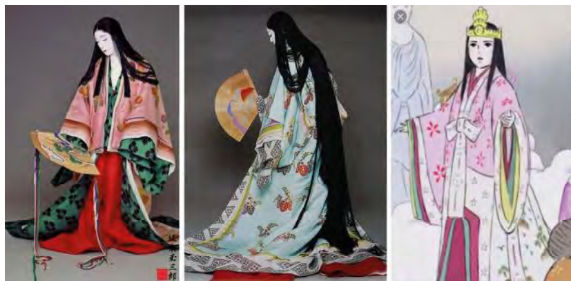
تصویر ۳. کیمونوی سنتی اوچیکاکه بر تن پرنسس کاگویا.