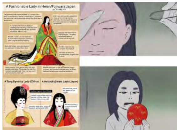
تصویر ۴. کندن ابرو و سیاه ردن دندان کاگویا به‌عنوان ملاک‌های زیبایی یک دختر نجیب‌زاده ژاپنی. منبع: (تصویر سمت راست: تصویر برداری مستقیم از انیمه. تصویر سمت چپ: URL 3)

در حوزه هنر شخصیت می‌تواند به صورت تخیلی همانند شخصیت افسانه‌ها بهره‌گرفته از عقاید سنتی بوده و به صورت امروزی اجرا شوند و یا از واقعیت‌های ممکن وام گرفته شده باشد. طراحی و خلق یک شخصیت به معنای ترسیم جوهره‌ی وجودی و ویژگی‌های درونی هستند که در واقع ترسیم گر حالات بیرونی و مشخصه‌های شخصیتی در قالب ظاهر آن است (خیریه، ۱۳۸۶: ۵۹). شخصیت در شاخه‌های تصویرسازی و انیمه در هنرهای تجسمی از اهمیت بالایی برخوردارند. می‌توان گفت در میان حوزه‌های هنری، انیمه و انیمیشن دارای بیشترین تمهیدات خلق شخصیت و با کارکرد هستند تمهیداتی مانند: حرکت، ویژگی‌های تصویری، صوت و گفتار و یا حتی قدرت بازیگری. در واقع یکی از بالاترین سطوح انیمه، بازیگری است و به صورت مستقیم با شخصیت اصلی موجود در ارتباط است. این دسته حرکات در انیمه فولکلور علاوه بر تأثیری که از طبیعت و عناصر سنتی می‌پذیرند دلیل‌های روانشناختی نیز در خود