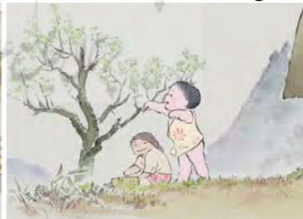
تصویر ۸. حضور درخت گیلاس در حیاط خانه کودکی و کاشت آن در عمارت کاگویا.