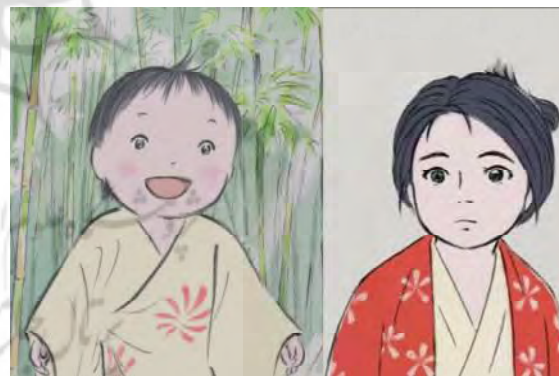
تصویر ۱. پوشش زردرنگ دوران کودکی کاگویا و پوشش قرمز رنگ در سنین جوانی.