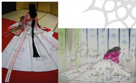
تصویر ۲. شباهت کیمونوی کاگویا (در حال آماده‌سازی) با کیمونوی یک دختر اشراف‌زاده ژاپنی.

آشنا بودن با انواع لباس‌های تاریخی و اجتماعی دوره‌های مختلف و ترکیب و هماهنگی لباس‌ها با صحنه و احساس رایج در لحظه از جمله امکانات سنتی هستند که احساسی فولکلور را به مخاطب امروزی به پشتوانه قابلیت‌های موجود در عنصر تصویر در انیمه منتقل می‌کنند. از زمان تولد، کاگویا بنابر زندگی روستایی در کنار یک پیرزن و پیرمرد کشاورز، لباسی بسیار ساده، تک‌رنگ و کوتاه بر تن داشته است، حتی در زندگی او در روستا خبری از صندل‌های چوبی هم نبود بلکه با پای برهنه فعالیت‌های روزانه خود را انجام می‌داد. شواهد موجود نشان از بی‌پیرایه و روستایی بودن زندگی کاگویا در سنین کودکی او نیز دارند، زندگی‌ای که سبک و شیوه سنتی آن بر نوع پوشش شخصیت‌ها در تصاویر انیمه تأثیرگذار هستند (Grajidian, 2003). پس از به‌دست آوردن هدایایی آسمانی توسط پیرمرد بامبو شکن، و منتقل شدن کاگویا به شهر و زندگی در عمارت شیوه زندگی و سیاق پوشش او نیز دستخوش تغییر شدند.