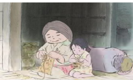
تصویر ۹. مشاغل روستایی ژاپنی در انیمه افسانه پرنسس کاگویا.