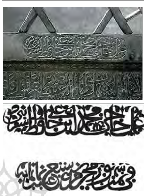
تصویر شماره ۵. کتیبه در میان ترنج کوچک در بالا و پایین کتیبه سمت راست پایین