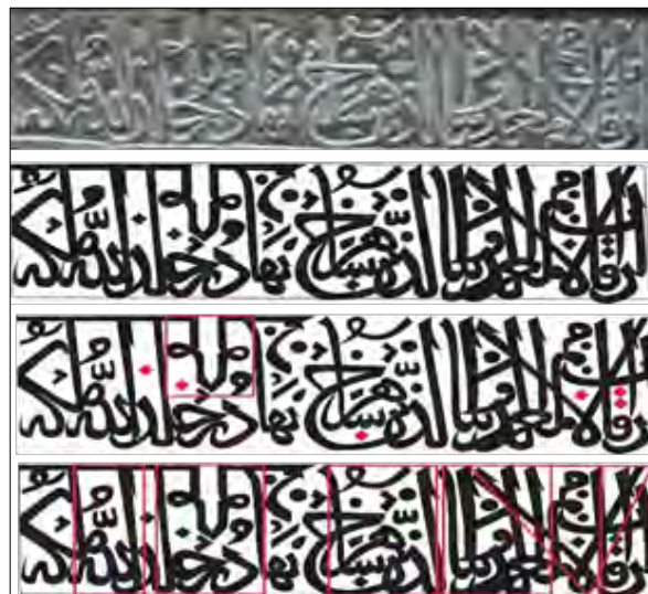
تصویر شماره ۳. کتیبه قسمت بالا سمت چپ پنجره فولادی (ماخذ: نگارنده)

در دورتادور این کتیبه از تزیینات هندسی و اسلیمی که در تصویر آمده است به صورت زراندود استفاده شده است که متأسفانه با گذر زمان بسیاری از آن از بین رفته است. تزیین مثلی تزیینی در دو طرف و به صورت عمودی آمده است و تزیین اسلیمی به صورت افقی در یک نوار تکرار شده و دو طرف آن نیز دو دایره که از مثلث‌هایی