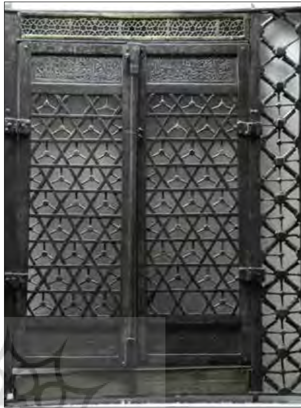
تصویر شماره ۱. پنجره فولادی در موزه حرم مطهر رضوی