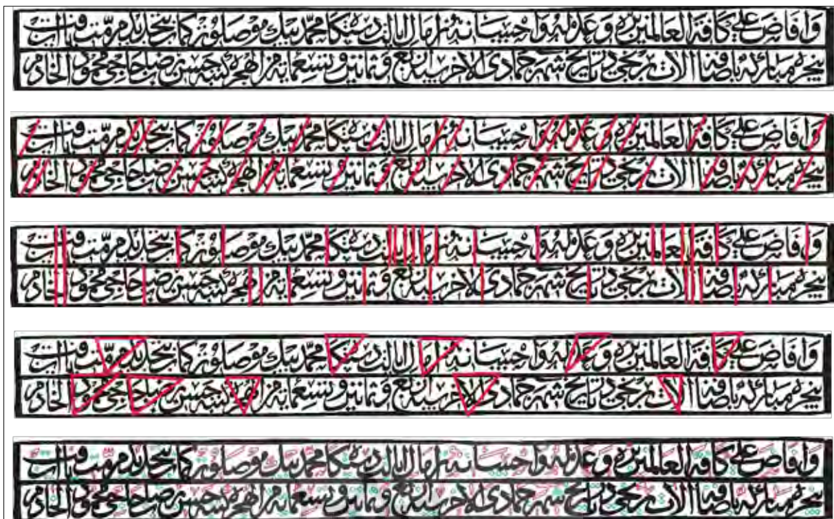
تصویر شماره ۶. کتیبه اضافه شده در سال ۹۸۴ در قسمت گم پنجره