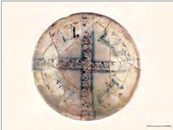
تصویر ۹: کاسه سفالین، ش ۶۳۰۳۱، موزه باستان شناسی مادرید، به تاریخ ۳۶۶-۳۲۴ ق.، از تولیدات مدینه الزهرا در دوران خلفای اموی.