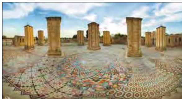
تصویر ۳: سی و یک طرح کاملاً انتزاعی در کف حیاط مجموعه خربه المفجر، در اردن، دوران امویان شامی.