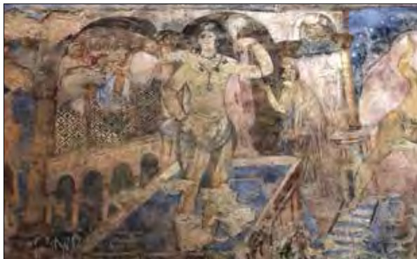
تصویر ۴: بخشی از نقاشی‌های دیوار حمام قصیر عمره در اردن، دوران امویان شامی.