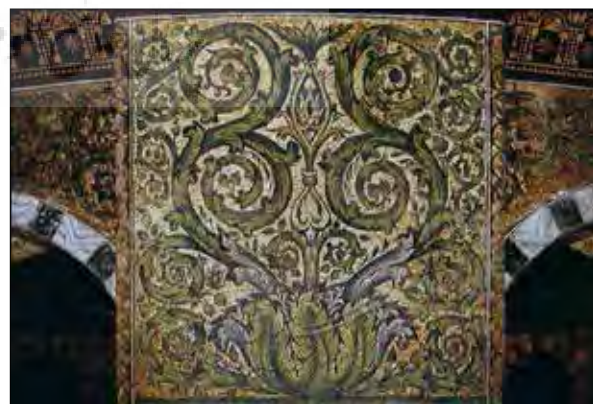
تصویر ۱: تصویر گلدان‌های ساسانی در تزیینات موزاییکی در قبه الصخره در بیت المقدس، دوران امویان شامی.

Figure 2: Images of palaces and cities in mosaic decorations in the Great Mosque of Damascus, the Umayyad period.