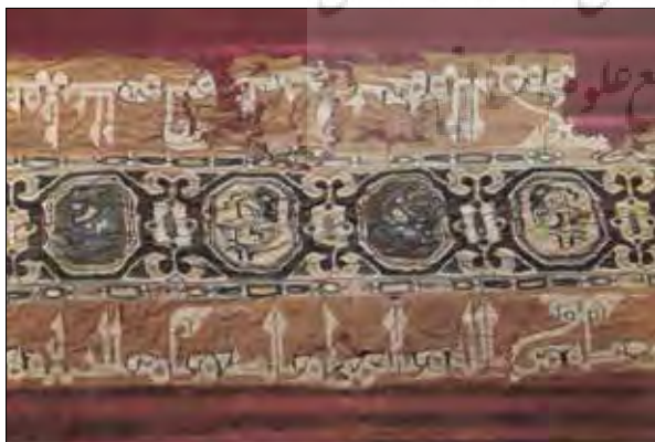
تصویر ۱۲: تکه پارچه‌ای حاوی عبارت دعایی در حق خلیفه مشهور به «حجاب هشام» (شماره ۲۹۲، آکادمی مادرید، تاریخ ۳۳۶ تا ۳۳۹ ق).

علاوه بر کتیبه‌های روی منسوجات، استفاده از پارچه‌های فاخر و نفیس توسط درباریان و تولیدات انبوهی از منسوجات نفیس هم به نوبه خود نشان تجمل پرستی در یک حکومت است (ابن خلدون، ج ۱، ۱۳۸۲، ۵۱۰). در متون تاریخی آمده که در حکومت عبدالرحمن دوم پوشش لباس حریر حاشیه‌دار در دربار امویان معمول شده و لباس‌هایی از جنس حریر بافته شده با نخ‌های طلا و نقره و حاشیه‌دوزی شده با سنگ‌های قیمتی در بین طبقه