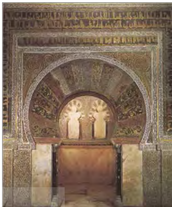
تصویر ۵: محراب مسجد قرطبه، در اسپانیا، دوران امویان.

یکی از مهم‌ترین کاخ‌های امویان در اسپانیا مدینه الزهرا است (شهری با چندین کاخ) (تصویر ۶) که توسط عبدالرحمن سوم به سال ۳۲۴ هجری قمری کمی پس از آن که عنوان خلیفه رابه خود داده بود ساخته شد و گویا این کاخ بازگوکننده آرزوها و اشتیاقات شاهانه او بوده است