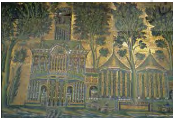
تصویر ۲: تصاویر کاخ‌ها و شهرها در تزیینات موزاییکی در مسجد جامع دمشق، دوران امویان شامی.

ولید که جانشین پدرش عبدالملک شد کاملاً به نقش مؤثر معماری در تبلیغات واقف بود و برنامه ساختمانی ولید صرفاً ساخت بناهای کاربردی نبود بلکه آنها متضمن مفاهیم سیاسی و نمادین هم بودند که این امر مهم باتوجه به هزینه‌های اجرای آنها، سرعت عملیات ساختمانی