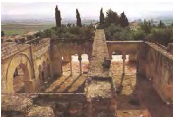
تصویر ۶: بخشی از مدینه الزهرا، در اسپانیا، دوران امویان.