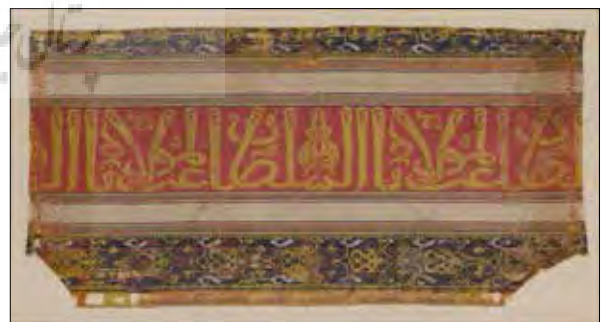
تصویر ۱۱: استفاده از واژه «سلطان» در یک تکه پارچه منسوب به اسپانیا (شماره ۱۸۳۱، موزه مترو پولیتن، اواخر قرن چهاردهم و اوایل قرن پانزدهم).

در تمدن اسلامی استفاده از خطوط نوشتاری بر روی منسوجات در دربارها هم از نمودهای تجملاتی است. بر اساس گفته ابن خلدون اولین خلیفه‌ای که لباس پادشاهی برتن کرده معاویه است (ابن خلدون، ج ۱، ۱۳۸۲، ۳۸۹) و هم‌اشاره می‌کند که دیگر از علائم شکوه و عظمت پادشاه و سلطان و شیوه‌هایی که در دولت‌ها متداول است این است که نام‌ها یا نشان‌هایی را که ویژه آنهاست در پارچه‌هایی از جنس پرنیان یا دیبا و یا ابریشم می‌نگارند و پادشاهان اسلام نام‌های خود را با کلمات دیگری که از فال یا درود و دعا حکایت می‌کند می‌نویسند و خانه‌هایی را که در کاخ‌های خود برای بافتن این‌گونه پارچه‌ها اختصاص داده بودند طراز خانه می‌نامیدند (ابن خلدون، ج ۱، ۱۳۸۲، ۵۱۰). طراز در تاریخ هنر اسلامی معانی مختلفی را در برمی‌گیرد از جمله اینکه به جامه‌های پر نقش و نگاری اطلاق می‌شود که غالباً برای حکمرانان و صاحب منصبان بافته می‌شده