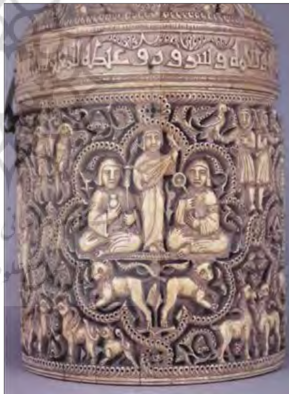
تصویر ۱۳: تصویر نمادهای سلطنتی (عود نواز و عطران، بادبزن) بر روی جعبه جواهرات مغیره، شماره ۴۰۶۸، موزه لوور، تاریخ ۳۵۷ ق.