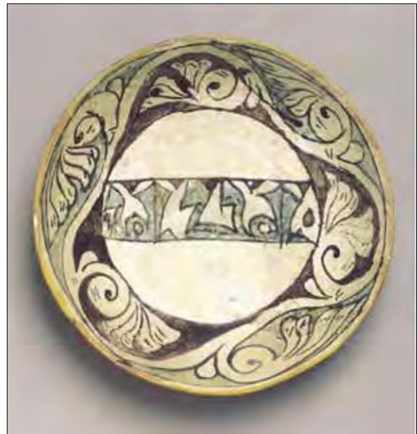
تصویر ۸: کاسه سفالین، ش ۶۳۰۴۳، موزه باستان شناسی مادرید، ۳۶۶-۳۲۴ ق. تولید شده در مدینه الزهرا در دوران خلفای اموی.