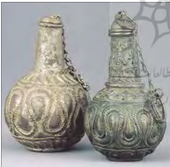
تصویر ۱۴: عطران، شماره ۳۷۷۲، موزه باستان‌شناسی اسپانیا، متعلق به دوران خلفای اموی، مأخذ تصویر: (Dodds, 1992, 213)

حاکم و اطرافیان وی بسیار رواج داشته است و همچنین آوازه شهر المریه در تمام سرزمین‌های مسلمان‌نشین به سبب زیبایی دیباها و منسوجاتش پخش شده است (وجدان، بی‌تا، ۲۱۶) و یا می‌بینیم که مسلمانان اسپانیا از سده چهارم هجری در سطح وسیعی به پرورش کرم ابریشم روی آورده‌اند و طرازهای نفیس و زیبایی را به مناطق اسلامی و غرب مسیحی صادر نموده‌اند (محمد حسن، ۳۸۹). از نظر میزان تولید چنین منسوجات تجملاتی در اسپانیا همین بس که آورده شده که در میان شهرهایی که در آن بافندگی رونق داشته، المریه به داشتن بیش از هشتصد ماشین پارچه‌بافی برای بافتن جامه‌های ابریشمین و پوشش نفیس و یک هزار ماشین برای تولید پارچه‌های زربفت شکوهمند مباحثات می‌کرده است (اتینگهاوزن و گرابار، ۱۳۹۴، ۱۸۹).