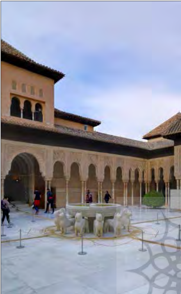
تصویر ۷: حیاط شیران در کاخ الحمراء، اسپانیا، دوران ناصریان، ۷۷۹ ق