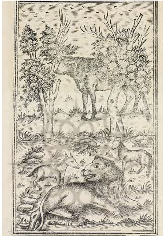
تصویر ۱: نقاشی شیر و شغال، کلیله و دمنه مصور چاپ سنگی، دوره قاجار.

دوباره خود را مشغول گفتگو با شیر کنند و بتوانند مقامی در دربار به دست آورند؛ مثلاً دمنه، زمانی که به برادرش کلیله می‌گفت: «می‌خواهم از قدرت و زیرکی خودم استفاده کنم و شیر را از ترس و وحشتی که دارد نجات دهم. با این کار می‌توانم موقعیت یکی از وزیران شیر را به دست آورم» (شرما، ۱۳۸۵: ۸۸). در کلیله و دمنه مصور چاپ سنگی این روایت تمثیلی به تصویر کشیده شده است. (تصویر ۱)