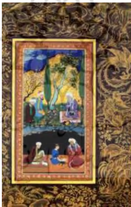
تصویر ۱: در محضر پیر، مرقع گلشن، ۱۶۰۵-۱۶۳۶/۱۰۱۴-۱۰۴۶، دوره صفوی، موزه کاخ گلستان.