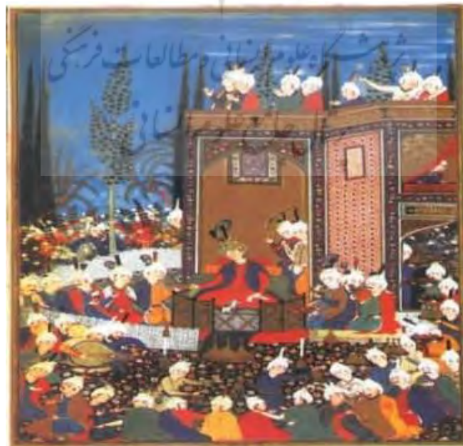
تصویر ۲: جشن عید فطر، دیوان حافظ، امضای سلطان محمد، مکتب تبریز، دوره صفوی، مأخذ: (بهرامی، ۱۳۸۹: ۱)

جمعیت با شادی کف زدند ، موسیقی آهنگ ملی بادابادا را شروع کرد و رقص‌ها مست و شیدا دور تماشاچیان رقصیدند و از شادی و هیجان عمومی، طوفانی را پدید آوردند که تا آخرین لحظه ادامه داشت (افغانی؛ ۱۳۴۴: ۶۵) از راه حرکت و جنبشی که مجسم‌کننده‌ی شادی و حالت بود ، این دو خواهر چنان شور و غوغایی در مجلس افکندند که همه نخورده، مست شده بودند. (همان: ۱۰۰) - این جا بود که دزدان عشق که پیوسته در کمینش بودند، از روزن شنیدند و از شادی و موفقیت بشکن زنان به آسمان جهیدند (همان: ۱۱۷).