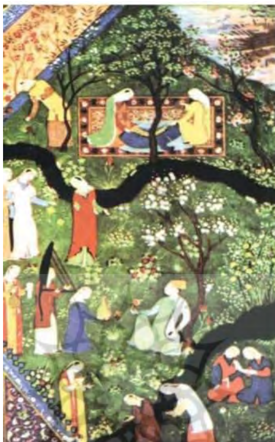
تصویر ۴: سلطان حسین بایقرا در باغ، کار بهزاد، مکتب تبریز، (مأخذ: ویلبر، ۱۳۸۴: ۸۹)