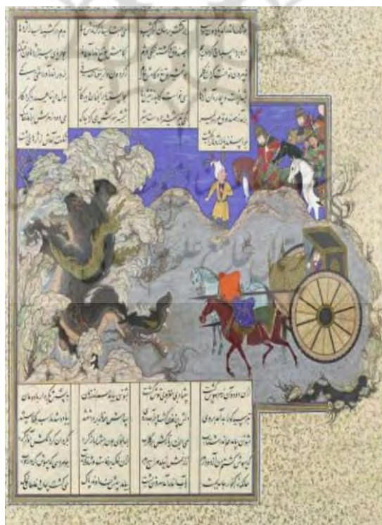
-تصویر ۵: نگاره نبرد اسفندیار با اژدها، شاهنامه شاه طهماسبی، مکتب تبریز، دوره صفوی، مأخذ: (طهماسبی عمران، ۱۳۹۶: ۳۹)

این استعاره سه بار در توصیف اوج شادی در «شوهر آهو خانم» آمده است، نویسنده براساس تجربه روزمره خود از حوزه مفهومی نیرو که نوعی قدرت است، برای نشان دادن قدرت شادی استفاده کرده و نیروی شادی را ملموس‌تر جلوه داده است. در واقع با استفاده از حوزه‌های ملموس نیرو و قدرت، حوزه انتزاعی شادی درک می‌شود. این درک از طریق نگاشت «شادی نیرو است» حاصل شده است، که باعث ایجاد اصطلاح «در پوست خود نمی‌گنجید»، شده است. -این مرد تاکنون به امید اسکناس‌های سبز و قرمزی که فردا باید مردم خوش‌گذران این ولایت در پیش رقص تازه کارش بچپانند، از خوشحالی در پوستش نمی‌گنجیده است (افغانی؛ ۱۳۴۴:۱۰۵) -شب بچه‌ها از طلاق هما و لطف حضور پدر در پیش خودشان در پوست خود نمی‌گنجیدند (همان: ۶۴۹)