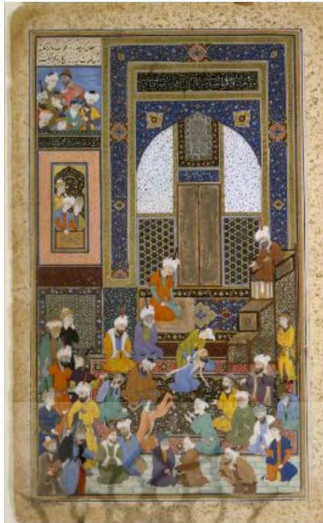
تصویر ۲: نگاره افشاگری در مسجد، دیوان حافظ، مرکزی بین‌المللی میکروفیلم نور.