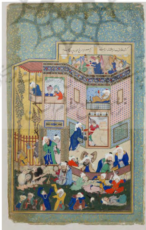
تصویر ۳: نگاره مستی لاهوتی و ناسوتی، دیوان حافظ، مرکز بین‌المللی میکروفیلم نور.