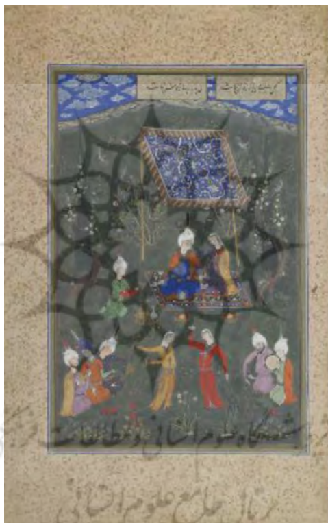
تصویر ۱: نگاره بزم عاشقان، دیوان مصور حافظ، مرکز بین‌المللی میکرو فیلم نور.

این تعابیر را می‌توان در نگاره‌های مصور دیوان حافظ نیز مشاهده کرد. تصویر ۱، به دیدار عاشقان اشاره دارد.