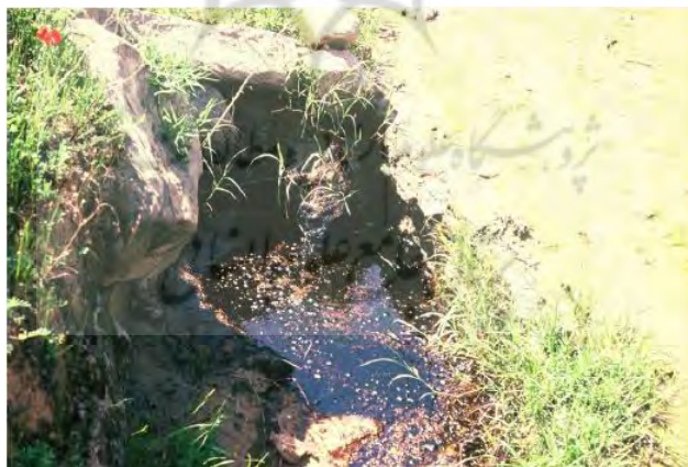
تصویر ۱- چشمه قیر طبیعی در منطقه دهلران (نگارنده، ۱۳۹۵)

آشنایی ساکنان ایران با نفت طبیعی و مشتقات آن به دوران پارینه‌سنگی در غارکلدر باز می‌گردد (Tumung et al, ۲۰۱۵: ۱۷۹-۱۹۶). ساکنان جنوب غرب ایران در دوران نوسنگی جزو اولین مردمانی بودند که با خصوصیات قیر طبیعی آشنا شده و به شیوه‌های گوناگون از آن استفاده کردند. آنها از خاصیت چسبندگی قیر طبیعی برای دسته‌گذاری ابزارهای متنوع نظیر داس‌های ترکیبی، کج بیل‌ها و درفش‌های استخوانی بهره می‌بردند. بر روی تیغه‌های سنگی و دسته‌های چوبی و استخوانی این‌گونه ابزارها آثار قیر طبیعی مشاهده می‌شود که نشان می‌دهد از این ماده طبیعی برای دسته‌گذاری ابزارها استفاده شده است (Connan, ۱۹۹۶: ۱۵۳). قدیمی‌ترین آثار استفاده از قیر طبیعی برای اتصال ابزار برنده سنگی به بدنه چوبی در ایران (غارکلدر) یافت شده است و متعلق به ۵۴۰۰۰ سال قبل می‌باشد (Tumung et al, ۲۰۱۵: ۱۷۹-۱۹۶). در این ادوار قیر به صورت طبیعی با استخراج از لایه‌های سطحی و زیرین زمین جمع‌آوری می‌شد. تصویر شماره یک انعکاسی از وجود آشکار نفت در منطقه جنوب غرب ایران است که تا عصر حاضر نیز در سطحی‌ترین لایحه زمین در این منطقه قابل مشاهده است (تصویر ۱).