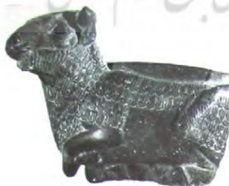
تصویر ۳- ظرف با دسته به شکل مجسمه،