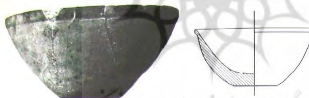
تصویر ۲- ظرف ساده لبه‌دار با بدنه محدب. جنس خمیر قیر (Connan, ۱۹۹۶: ۱۵۱)

هم‌چنان‌که پیش از این گفته شد، در هزاره چهارم قبل از میلاد در دشت شوشان با ترکیب قیر طبیعی با شن و ماسه بادی، پودر سنگ آهک، مواد معدنی و گیاهی و حرارت کم به این مواد، ماده جدیدی به نام خمیر قیر بدست می‌آمد که از آن تا اواسط هزاره اول قبل از میلاد برای ساخت ظروف تزیینی و مصرفی، مهرهای مسطح و استوانه‌ای، سنگ وزنه، مهره‌ها و آویزها و ساخت ظروف استفاده می‌کردند (تصاویر ۹-۲).