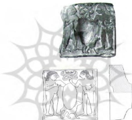
تصویر ۵- پلاک تزئینی با نقش مذهبی. خمیر قیر (Connan, ۱۹۹۶: ۲۰۶)

تصویر شماره ۲ و ۳ و ۴، حاکی از کاربرد قیر در ساخت ابزار و ظروف زندگی روزمره است. این نکته خود تأییدی بر نقش پررنگ این ماده در حیات اجتماعی مردم در ایران دوره باستان دارد.