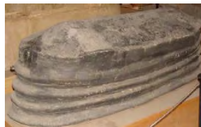
تصویر ۷- تابوت سفالی قیراندود. هفت تپه. ایلام میانی (آرشیو میراث خوزستان، ۱۳۹۰)

در دوران ساسانی "خمره‌های کشف شده در بوشهر دارای خمیره‌ای با بافت ماسه‌ای و بدنه‌ای استوانه‌ای بودند که به کف مخروطی شکل ختم می‌شدند. لبه این خمره‌ها فتیله‌ای بود و با استفاده از قیر طبیعی بخش انتهایی آنها اندود شده است. این خمره‌ها که به نام خمره‌های اژدری شناخته می‌شوند، از محوطه‌های ساسانی در مرکز و جنوب بین‌النهرین و جنوب غرب ایران به دست آمده‌اند" (Adams, ۱۹۸۱: ۲۳۴؛ لباف‌خانیک و دیگران، ۱۳۹۲: ۷۷). تولید ظروف اژدری از دوره اشکانی آغاز و تا اوایل دوره عباسی ادامه داشته است. این ظروف که با استفاده از لایه‌ای از قیر طبیعی نشت‌ناپذیر می‌شدند، احتمالاً گونه‌ای محلی از نوع آمفوراها رومی برای انتقال شراب و مایعات بودند (Zemer, ۱۹۷۷). قیر در معماری در دوره تاریخی و بخصوص دوره ایلام، از قیر طبیعی به عنوان ملاط بین آجرها برای ساخت بناهای شهر شوش، هفت تپه و چغازنبیل استفاده شده است. معمولاً از قیر به عنوان ملاط در ساخت بناهایی مانند آرامگاه‌های مهم، آبگیر و بندها، حوض‌ها، مجاری و کانال‌های آب و آجر فرش حیاط‌های روباز استفاده می‌گردید. استفاده از این تکنیک علاوه بر دوره ایلام، در دوران هخامنشی نیز ادامه یافت و در ساخت بناهایی که میزان رطوبت در آنجا بالا بود، از قیر به عنوان ملاط استفاده شده است. در مواردی نیز در دوره ایلام برای نصب آجرهای لعابدار، از گل میخ‌های آغشته به قیر استفاده شده است (زاهدی، ۱۳۷۸: ۱۷).