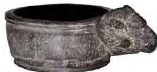
تصویر ۴- کاسه‌ای به شکل یک قوچ از خمیر قیر. (آرشیو: موزه ملی ایران).

تصویر شماره ۲ و ۳ و ۴، حاکی از کاربرد قیر در ساخت ابزار و ظروف زندگی روزمره است. این نکته خود تأییدی بر نقش پررنگ این ماده در حیات اجتماعی مردم در ایران دوره باستان دارد.