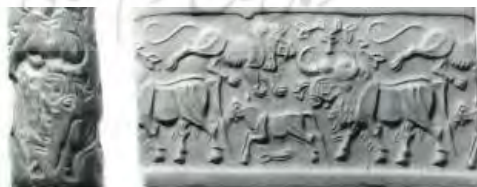
Connan, ۱۹۹۶: ۲۱۲ (تصویر ۶- مهر و اثر مهر استوانه‌ای هزاره سوم ق.م. خمیر قیر )

تصویر شماره ۵ گویای نقش پررنگ قیر در عناصر تزئینی در ایران در دوره باستان است؛ تزئیناتی که از مجسمه‌ها تا تزیینات بناها را در بر می‌گرفت.