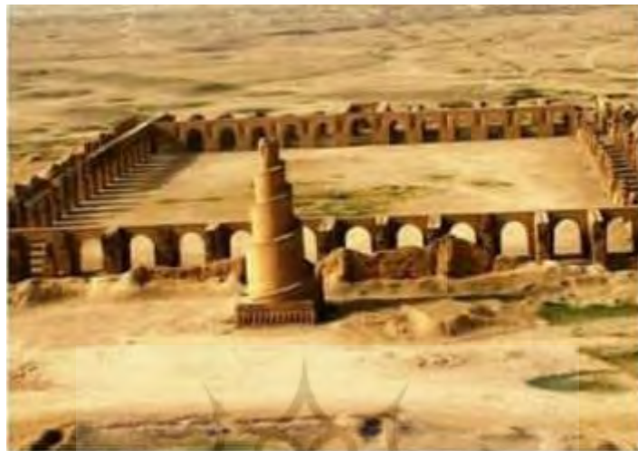
تصویر ۲: مسجد جامع سامرا، دوره عباسیان، مأخذ: (ممبینی و همکاران: ۱۳۹۷)

تزئین قسمت‌هایی از مساجد به خصوص گنبد و مناره‌ها هنرنمایی داشته‌اند. در حالی که دیوارها و زمین آن به دلیل حکم دین اسلام مبنی بر پرهیز از تصویرگری و تجسم، از هرگونه نقش و نگار خالی بود (خطیب بغدادی، ۱۴۱۷: ۷۶/۱). در تصویر شماره (۲) نمایی از مسجد جامع سامرا منعکس شده که در دوره خلافت متوکل عباسی بنا شده است.