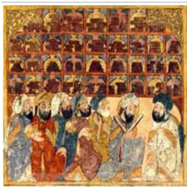
تصویر ۳: نگاره الحلوانیه، کتاب مقامات حریری، اثر یحیی الواسطی، مأخذ: (ماه وان، ۱۳۹۲)

مرکز اصلی مکتب نقاشی عباسی، شهر بغداد بوده است. مکتب بغداد نامی است برای آشناسازی نقاشی‌های متعدد کتاب‌های خطی در حکومت عباسیان به خصوص آثار خلق شده در پایتخت آنها، بغداد. مکتب عباسی سنت‌های تصویری کلاسیکی، بیزانسی و مانوی و نیز نوعی واقع‌گرایی را تلفیق کرده است که می‌توان در آثار این عصر مشاهده کرد (الگ گرابر، ۱۳۷۹: ۱۷۸). در عصر عباسی همزمان با تألیف و ترجمه کتاب‌های علمی درباره پزشکی، نجوم، مکانیک و فیزیک توضیح تصویری در این نوع کتب ضرورت پیدا کرد حتی برخی نقاشی‌ها از نسخه اصلی یونانی گرفته شد. در این زمان نقاشی و مصورسازی کتاب‌های داستان و تاریخی نیز رونق یافته است. طی قرن‌های ۶-۷ این کتاب‌ها به دست هنرمندان مسلمان ایرانی، مسیحی و عرب رسید؛ از این رو نقاشی‌های غیر متجانس در آنها چیز عجیبی نیست.