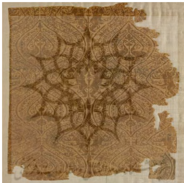
تصویر ۴: پارچه با نقوش حیوانی و هندسی، دوره عباسیان، (۷۵۰-۱۲۵۸م) در موزه کلیولند.

واژه «طراز» معرب و به معنی نگار جامه است، سیوطی در کتاب/المزهر گفته: فمّا اخذوه العرب من الفارسیة. (سیوطی، ۱۳۶۹: ۲/ ۱۹۷) اصطلاحاً «طراز» به نوعی پارچه با حاشیه‌ای از نوع علامت یا نوشته اطلاق می‌شد که به‌صورت بافته یا گلدوزی شده بود. این حاشیه روی لباس مأموران دولتی نقش می‌بست و به شیوه معمول تاروپودی از رشته‌ای طلا و نخ‌های رنگی دیگر داشت (چیت‌ساز، ۱۳۷۹: ۳۲). تصویر شماره (۴) نمونه‌ای از طرازهای دوره عباسی را نشان می‌دهد.