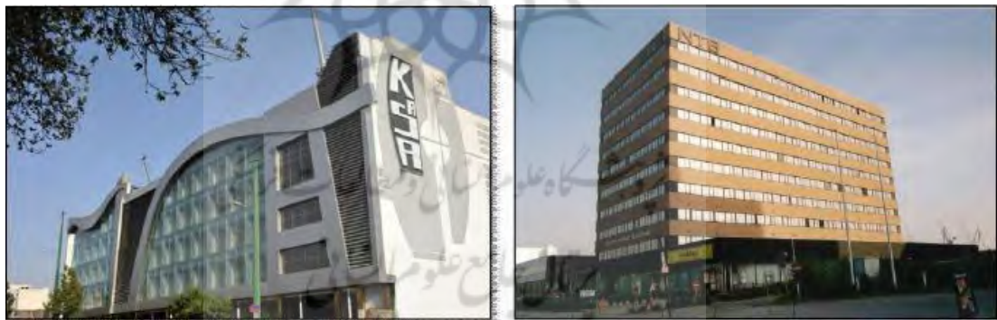
تصویر ۲: سیمای دو مرکز تجاری در ایران و اروپا.

تصویر ۱. بروز بحران هویت در معماری و شهرسازی معاصر ایران به دلیل عدم تجانس و تناسب مبنایی بینشی و ارزشی این نظام با کنش‌ها و سبک‌های کالبدی آن (ریبسی، ۱۳۹۵: ۷۱)