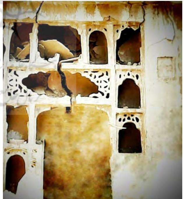
تصویر ۳. نقلدونی خانه قصاب_خلج، دزفول.

نقلدونی عنصری سرشار از زیبایی، جذابیت، شکوه و سودمندی است که کم و بیش در خانه‌های قدیمی دزفول یافت می‌شد. این فضاها به دو صورت ساده و مفصل طراحی و ساخته می‌شدند و عمدتاً از جنس گچ و محلی برای نگهداری از اشیاء قیمتی و عتیقه بوده‌اند. براساس مطالعات انجام‌شده به نظر می‌رسد.