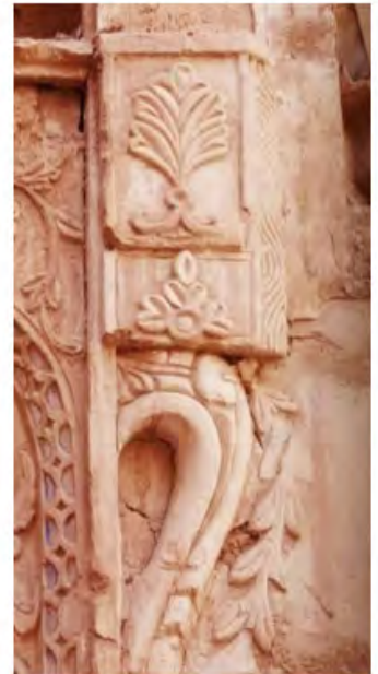
تصویر ۴. نقش گلدسته و دو گل بالای آن.