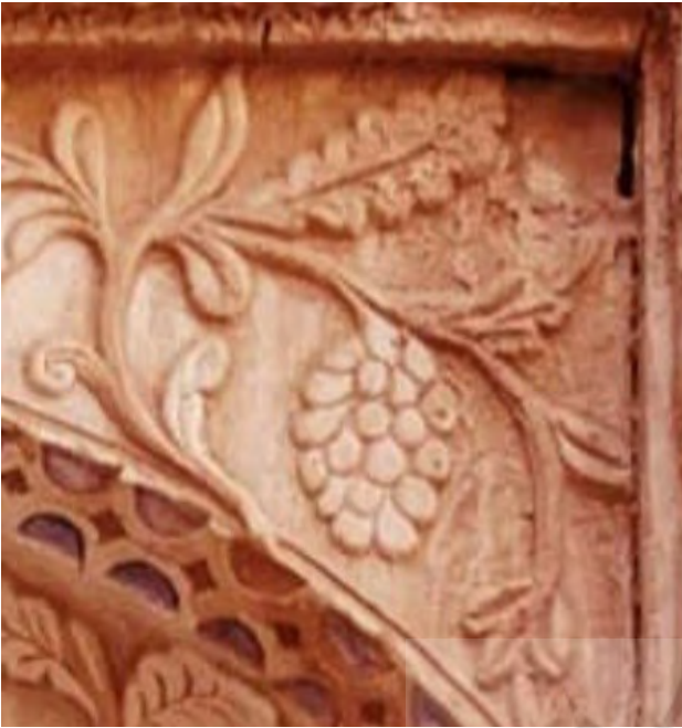
تصویر ۵. نقش گل همیشه بهار.