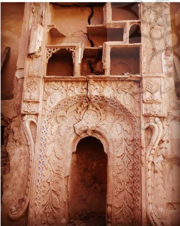
تصویر ۷. نقلدونی.