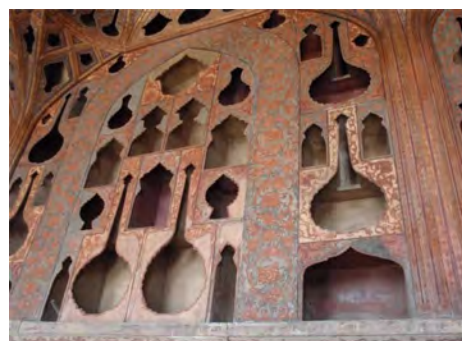
تصویر ۱. نقلدونی در کاخ‌های عصر صفویه.