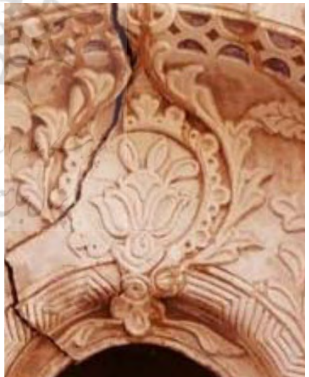
تصویر ۶. نیلوفر آبی با هشت گلبرگ.

تقسیم‌بندی و طاقچه طاقچه کردن یک قسمت از جداره داخلی اتاق، علاوه بر جنبه تزیینی که جلوه‌ای زیبا از هنر گچبری را