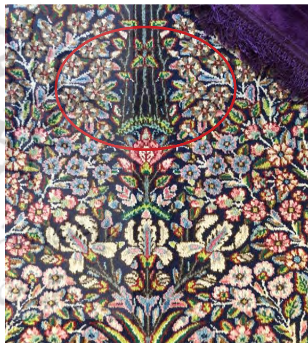
تصویر ۵. مشابهت گل مشکیجه نوع پُرپر (نوع ۱) با نقوش موجود در قالی کرمان.

شرایط بستر هستند در مناظر شهری و یا ملک‌های خصوصی فراموش شده است. تمایل افراد به انتخاب گیاهان وارداتی که صرفاً جنبهٔ زینتی دارند و به دور از اصل سودمندی، دو پیامد به همراه داشته است؛ موجب شد تا گل و گیاهان بومی و سازگار این سرزمین از جمله مشکیجه، از جایگاه ارزشی خود خارج شوند و رو به انقراض گذارند، در حالی که گیاهان غیربومی نیازمند نگهداری و رسیدگی بیشتر و موجب