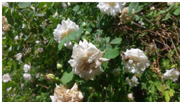
تصویر ۱. گل مشکیجه نوع اول. مکان: روستای گل افشان، اواسط اردیبهشت.

در بخشی از کاشی کاری معرق بر سردر مدرسه ابراهیم خان قاجار، واقع در بازار سرای ابراهیم خان، تابلویی عمودی با زمینه آبی دیده می شود که نقش آن درختچه ای با گل های ریز سفید است که بر داربستی واقع شده است. تابلوی دیگری افقی با همین نقش در حمام گنجعلیخان وجود دارد (تصویر ۴). این گل ها که به شکل افشان بر شاخه های