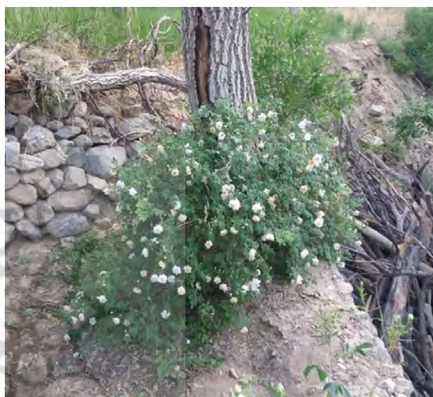
تصویر ۲. گل مشکیجه نوع اول. مکان: روستای بنادک السادات، اواخر اردیبهشت. عکس: فرزانه السادات دهقان، ۱۳۹۸.