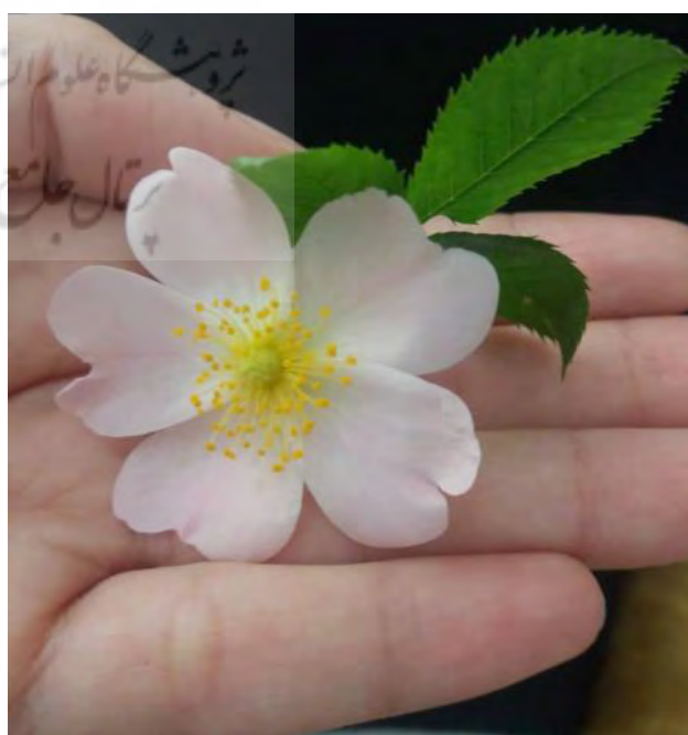
تصویر ۳. گل مشکیجه نوع دوم. مکان: یزد، اوایل اردیبهشت. عکس: فرزانه السادات دهقان، ۱۳۹۸.