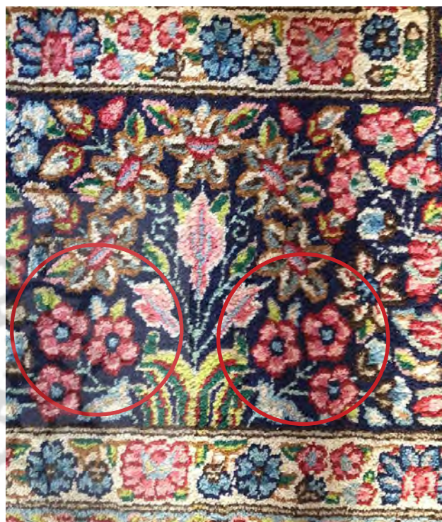
تصویر ۶. مشابهت گل مشک‌یجه نوع کم‌پر (نوع ۲) با نقوش موجود در قالی کرمان، عکس: شهره جوادی، ۱۳۹۷.

جدول ۲. جمع‌بندی ویژگی‌های گل مشک‌یجه از برداشت‌های میدانی. منبع: نگارندگان.