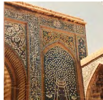
تصویر ۴. سر در مدرسه ابراهیم خان، کرمان. عکس: شهره جوادی، ۱۳۹۷.

رنگ‌بندی و شمایل ظاهری گل: رنگ صورتی گل، رنگ‌بندی و شمایل ظاهری برگ‌ها. مکان گل: همانند واقعیت گل‌هایی در لابه‌لای گیاهان یا پای درختان. از مجموع اطلاعات به‌دست‌آمده از مطالعات میدانی برداشت می‌شود که ویژگی‌های کلی گل مشکبجه از قرار زیر است (جدول ۲).