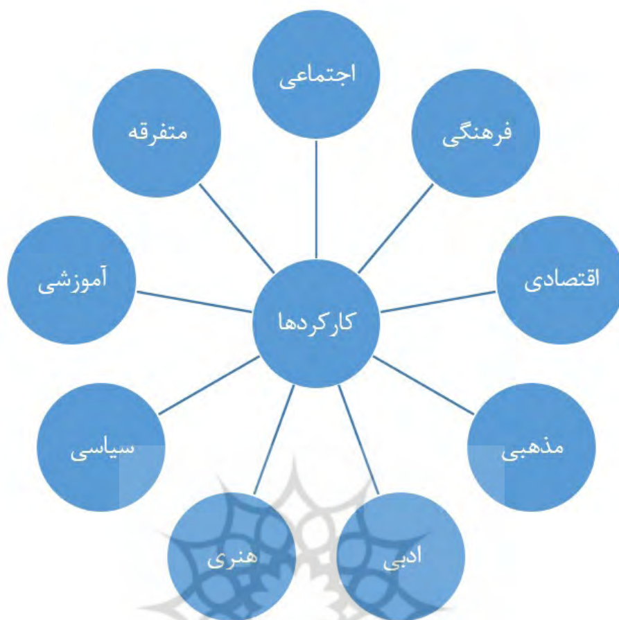
تصویر ۱. کارکردهای قهوه‌خانه.

که همین فضاها نیز با تأثیرپذیری از هویت قهوه‌خانه‌های قدیمی، کارکردهایی فراتر از عرضه غذا و نوشیدنی داشته و به‌عنوان مثال همان‌گونه که در قهوه‌خانه‌های قدیمی بازی یکی از شیوه‌های گذران وقت بوده، در قهوه‌خانه‌های امروزی نیز علاوه بر چای و قلیان، ابزارهایی را برای بازی‌های رایانه‌ای در اختیار مراجعان قرار می‌دهند. در رویکرد منظرین، مکان به‌صرفه محلی کالبدی مورد بررسی قرار نمی‌گیرد و معنا و هویت آن بر مبنای کارکردها، نقش آن در جامعه و تعامل و ارتباطش با جامعه تعریف می‌شود. قهوه‌خانه با توجه به هویتی که در این مقاله به آن پرداخته شد، فراتر از کالبدی فیزیکی بوده و دارای هویتی است که در طول تاریخ در فرهنگ ایرانی شکل گرفته و با آن عجین شده است و هنوز هم می‌توان این امر را در برخی از قهوه‌خانه‌های سنتی باقی‌مانده از دوران قاجار یا پهلوی جستجو کرد. با توجه به مطالعه انجام‌شده مشخص شد که قهوه‌خانه با در نظر گرفتن کارکردهای متنوع و مختلف، دارای ظرفیت مناسبی برای تبدیل شدن به منظر است. به عبارت دیگر قهوه‌خانه