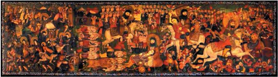
تصویر ۱. پرده درویشی، نقاشی رنگ و روغن روی بوم ابریشمی، دوره اوایل دوره قاجار، ابعاد: ۲۱۰×۷۳۳.