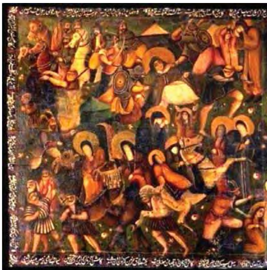
تصویر ۴. بخش سوم روایت در پرده درویشی بخش جدید.