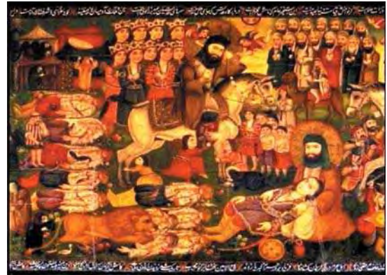
تصویر ۳. بخش دوم روایت پرده درویشی بخش قدیم، مأخذ: همان.