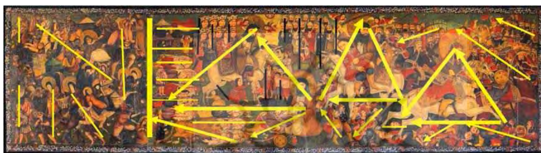
تصویر ۱۱. حرکت محوری پیکره‌های اصلی تصویر در بخش قدیم و جدید پرده درویشی .

ارکان عرش را به تلاطم در آورند بررسی تحلیلی رنگی و فرمی در این پرده نقاشی نشان می‌دهد که در بخش قدیم نقاشی هنرمند مهارت استفاده از زبان نمادین در تصویر را داشته است و این امر از مهارت هنرمند در شکل و فرم پیکره‌ها و نشان دادن شبیه سازی با وقایع عاشورا، نمایش ساختاری هر واقعه برای مخاطب قابل تشخیص است و هر بخش از تصویر دارای ساختار واحد و مشخص بوده و در عین حال از زیر مجموعه کلی قوانین بصری تصویر پیروی می‌کند. مهارت و حساسیت نقاش یا نقاشان در بخش قدیم حاکی از تخصص و مهارت آنها در امر طراحی، رنگ گذاری و نقاشی در ابعاد بزرگ بوده است که توانسته اند این حجم از پیکره‌ها را در یک فضای محدود نقاشی کنند. امر دیگر در این تصاویر پرداختن به چهره‌ها است که دارای شخصیت پردازی مجزا از هم است و هر کدام دارای شخصیت تصویری خاص خود می‌باشند. هر پلان در این تصویر داستان ویژه ای از عاشورا را تصویر می‌کند و روز تاسوعا و عاشورا و وقایع آن کاملاً مجزا است و به راحتی قابل تشخیص است. با وجود اشاره به ساختارهای کلی در هر پلان در بخش قدیم به یکدیگر در جزئیات شبیه نبوده و هر بخش دارای تغییرات رنگی و فرمی مستقل به خود است. زبان