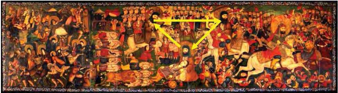
تصویر ۱۲. مثلث مهمترین شخصیت و کانون تصویر، امام حسین ع.

گاهی جهش‌های چشم نیازمند رانش‌های جهت دار نیرومند یا جذابیت‌های موثر است. (اوکریک و دیگران، ۱۳۹۷: ۹۷) استفاده از نسبت‌های هندسی و هندسه ایستا در هنر نقاشی دوره قاجار به سبب ورود پرسپکتیو در نقاشی دچار تحول شد. استفاده از تناسب‌های هندسی غربی در کنار هندسه ایرانی نوعی فضای نامتقارن و واقعی را در تصویر ایجاد می‌کند. در این تصویر همچنان که ذکر شد دو نوع زاویه دید از روبرو در بخش قدیم و در بخش جدید زاویه دید از پهلو وجود دارد. حرکت در این تصویر در بخش قدیم و جدید از یکدیگر مجزا بوده و در تصاویر هر بخش دیده می‌شود. در بخش قدیم چنان که در تصویر مشاهده می‌شود سه مثلث اصلی وجود دارد که کلیه فضای عمودی و افقی تصویر در راستای همان مثلث‌های اصلی و نقاط اصلی تصویر است، مثلث اصلی تصویر چنان که در تصویر ۱۲ دیده می‌شود سر امام حسین ع است ولی در بخش قدیم در سمت راست تصویر نقطه مشخص و هندسه مشخصی وجود ندارد و تنها فرم‌ها به صورت بی هدف استفاده شده است و یکی از بخش‌های اصلی تفاوت فکری هنرمندان بخش قدیم و جدید تصویر را نشان می‌دهد و دلیلی برای وجود نظم بصری و هندسی در بخش قدیم تصویر است. چنانچه در تصویر ۱۱ دیده می‌شود ساختار هندسی تصویر بر سه مثلث اصلی تصویر استوار است ولی در بخش جدید چپ این ساختار هندسی و نظم دیده نمی‌شود. همچنین کانون مرکزی تصویر به سر امام حسین ع ختم می‌شود که نقطه کانونی تصویر است و در تصویر ۱۲ مشخص شده است.