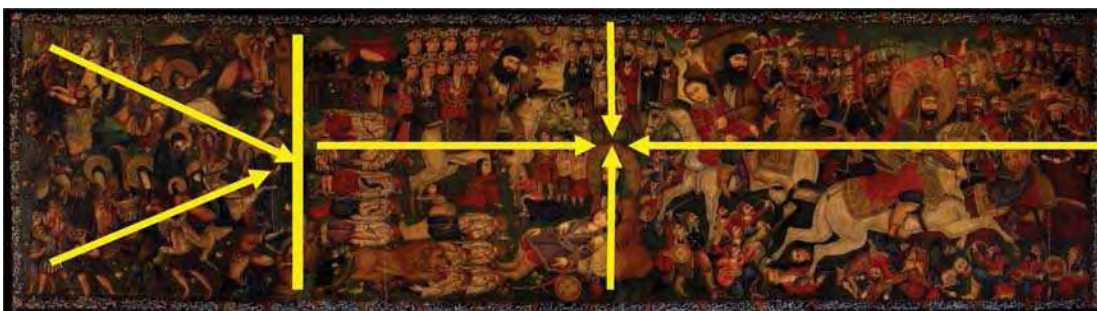
تصویر ۱۸. تفاوت زاویه دید در بخش جدید و قدیم تصویر.

عناصر انسانی در بخش قدیم نقاشی دارای دسته بندی امام، معصومین، سپاهیان، فرشتگان، جنیان، زنان، کودکان و شهیدان هستند. اگر تابلو در بخش قدیم را به دو بخش تقسیم کنیم بخش اول و سمت راست از لحاظ زمانی وقایع روز تاسوعا را مشخص می کند و شخصیت اصلی داستان حضرت ابوالفضل عباس ع است و در بخش دیگر که به وقایع عاشورا اشاره دارد امام حسین ع، مهمترین