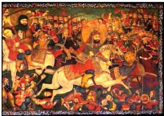
تصویر ۲. بخش اول روایت پرده درویشی بخش قدیم، مأخذ: همان.

اکبرع و حضرت علی اصغر ع و بخش سوم به اسارت بردن حضرت زینب ع و کودکان و اسارت به سمت دمشق است. بخش اول و دوم پیکرنگاری درباری بوده، این بخش نقاشی، بخش پرده شاهی بوده و با کیفیت نقاشی درباری کار شده است ولی بخش سوم که بعدها اضافه شده توسط نقاشان عامی تصویر شده و ویژگی‌های نقاشی درباری و کیفیت بالای رنگ گذاری، قلم گیری را ندارد.