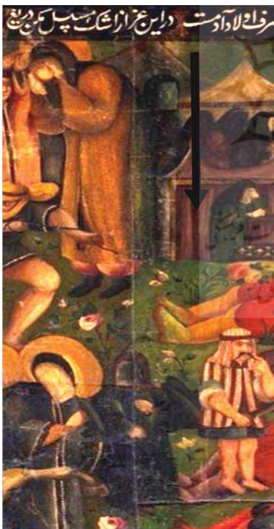
تصویر ۵. خوشنویسی بخش قدیم، مشخص شده از زیر رنگ در بخش جدید.

روایت بخش سوم شام غریبان و به اسارت بردن اسیران و اهل حرم است. در این بخش سرانجام زنان حرم امام حسین ع را همراه تنها پسر باقیمانده امام حسین ع یعنی حضرت سجاد ع را به اسارت دمشق می‌برند. در