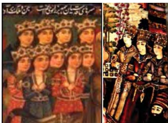
تصویر ۱۷. مقایسه تصویر فرشتگان در نقاشی جلد کتاب سمت چپ و نقاشی پرده درویشی سمت راست.

اگر برای چکمه ها و سپرها استفاده شده است. فضای اطراف پیکرها چه فرعی و چه اصلی با رنگهای سبز خاکستری و سبز برای زمین احاطه شده است. در قسمت جدید رنگها دارای تم خاکستری و خاموش هستند. متأسفانه در مرمت این اثر ورنی زیادی استفاده شده و ناآگاهی مرمتگر رنگهای بخش قدیم را تاحدی خاموش کرده است ولی می توان ارزش های رنگی و ملاحظات و دانش رنگی نقاش را ملاحظه کرد و تفاوت درخشش رنگی فاحشی بین دو بخش نقاشی دیده می شود. در بخش قدیم رنگها درخشان و پاک و در تطبیق با موضوع تصویر به کار برده شده است ولی در بخش جدید این امر دیده نمی شود. تمام موارد تحلیل شده در این بخش در جدول شماره ۱ خلاصه می شود.