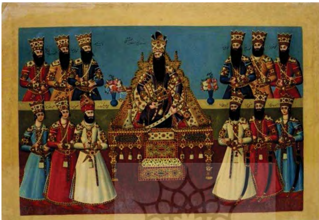
تصویر ۱۴. هنرمند ناشناس، کپی دیوارنگاره عبدالله خان معمارباشی، گواش روی کاغذ، ۱۸۵۱م، Sackler Gallery، مأخذ: https://www.si.edu/Museums/sackler-gallery

پیکره‌های اصلی و مقام نگاری شده را مشخص می‌کند و حتی جایی که دو شخصیت امامان با هم هستند دو فرشته دیده می‌شود. مثال کنار حضرت امام حسین ع و حضرت علی اصغر ع دو فرشته دیده می‌شود. در رابطه با این پرده درویشی می‌توان ادعا کرد که نقاش در بیشتر تصاویر ترسیم شده در این پرده سعی کرده است که تصویر مطابق با واقعیت‌های حماسه عاشورا باشد. منحصر به فرد بودن و بزرگ بودن این پرده درویشی که در زمان فتحعلی شاه کار شده دارای خصوصیات نقاشی درباری قاجاری است که در تصویر (۱۷) دیده می‌شود. کانون تصویر پیکره اصلی است پیکره‌های دیگر در اطراف آن و با حالت احترام دست و به ردیف تصویر شده اند. این موارد در تصویر (۱۴ و ۱۵) فرم قرار گیری فرشتگان و درباریان، لباس و آرایش تاج، احترام دست‌ها روی یکدیگر دیده می‌شود. این شباهت به سبک نقاشی دوره ابتدایی قاجار و رعایت قوانین پیکرنگاری مشخص می‌کند این نقاشی به سبک درباری و شاهی ولی با موضوعی مذهبی کار شده است و احتمال می‌رود این اثر کار یک نقاش باشی درباری قاجاری باشد زیرا قوانین پیکرنگاری، ترتیب ایستادن و احترام از الگوهای نقاشی درباری قاجار در دوره اول تقلید شده است. پس می‌توان فرشته‌ها را علاوه بر اینکه به عنوان یک نشانه الوهیت در هر بخش در بالای سر امام یا معصوم قرار