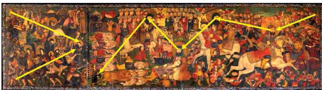
تصویر ۱۰. جهت حرکت تصویر از لحاظ بصری در بخش قدیم و جدید .