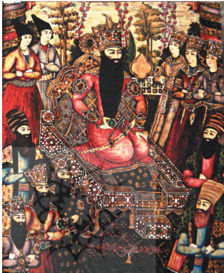
تصویر ۱۵. جزیی از تصویر جلد کتاب فتحعلی شاه و پسرانش، قرن ۱۹، مجموعه هنر اسلامی مالزی، مأخذ: Qajar ceramics, 2019: 11

چندین واقعه در روز کربلا هم زمان با هم دیده می‌شود و هر داستان دارای مرکزیتی مجزا است. در نقاشی بخش قدیم برای نمایش داستانها از دیده‌های مخالف و نشان دادن همه حوادث در یک نگاه به مخاطب استفاده شده است ولی در تصویر پلان جدید تنها از دید پهلو برای نمایش تصاویر شام غریبان استفاده شده است و هنرمند از درایت آگاهانه نقاش در بخش قدیم اثر برخوردار نبوده است. در بخش جدید دید سه بعدی نیست و یک بعدی بوده و در راستای خط افق و به صورت یک وجهی ارائه شده است. دید در تابلو بخش قدیم از روبرو بوده ولی در بخش جدیدتر از کنار یا پهلو است. در نقاشی‌های پرده‌های درویشی همواره حرکت روایت از سمت راست به چپ صورت می‌گیرد زیرا درویش داستان را از راست به چپ روایت می‌کند. این موارد در تصویر ۱۸ مشخص می‌شود.