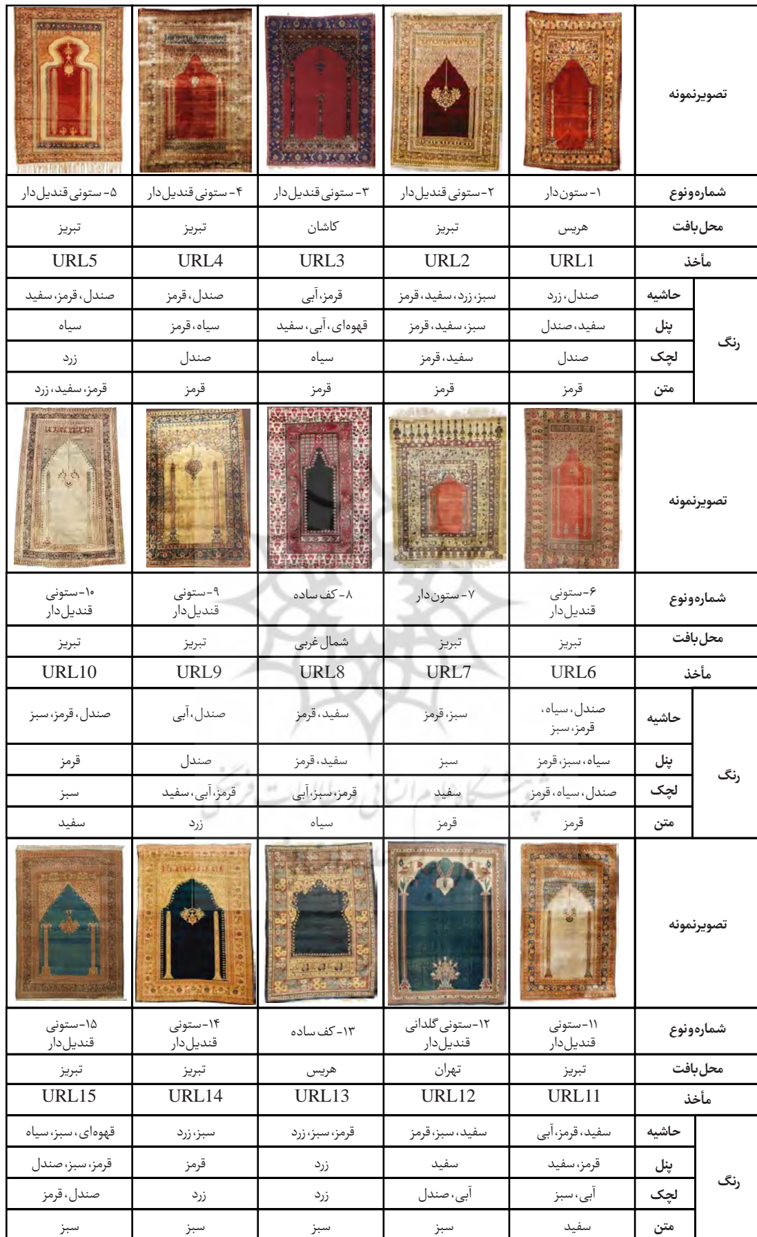
جدول ۳- معرفی رنگ‌ها و جایگاه آن‌ها در قالی‌های محرابی (نگارندگان)