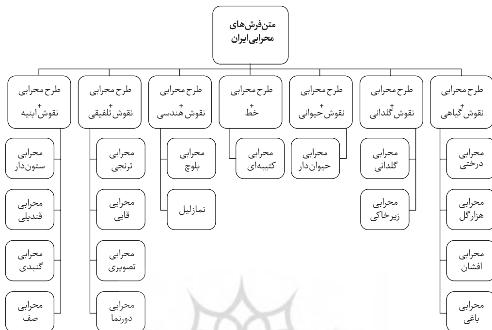
نمودار ۲- تنوع طرح های محرابی (حاجی زاده و دیگران، ۱۳۹۵: ۵۵)

محرابی سجاده ای، جملگی برای نماز استفاده شده و در نتیجه کاربرد آیات و احادیث به ویژه در فضای دو طرف طاق محراب و کاربرد نقوش در راستای تمرکز بر خدا و