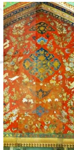
تصویر ۱۳- جزئی از دیوارنگاره چهل ستون اصفهان

جانورنگاری که در دیوارهای چهل ستون قزوین و اصفهان انجام گرفته ریشه در مکتب تبریز و قزوین دارد. نقوش جانوری به کاررفته در چهل ستون قزوین از تنوع کم‌تری برخوردار است، جانوران در یک طبیعت پراز درختان شکوفه دار و انواع بوته‌های گل، گل‌های ختایی و برگ‌ها، منظره‌ای بهشتی را به نمایش می‌گذارد که نظیر آن‌ها را در مکتب تبریز