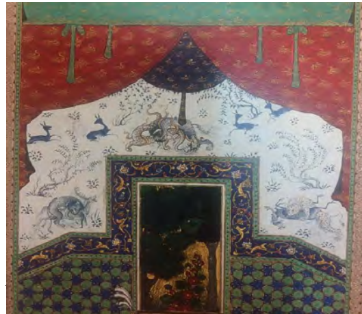
تصویر ۲- شاهنامه شاه‌تهماسب (canby, 2011: 126)

پیش‌تر درباره نقاشان چهل ستون قزوین بحث شد و در تکمیل آن باید گفت صادقی بیگ افشار شاگرد و ملازم شبانه‌روزی استاد مظفرعلی (اشراقی، ۱۳۵۶: ۲-۹)، احتمالاً در کنار استاد هنرنمایی کرده است. شاه‌تهماسب خود مجلس یوسف و زلیخا و نارنج‌بری خواتین مصر و زنان زیبا را نقاشی کرده است (منشی قمی، ۱۳۸۳: ۱۳۸). شاید میرزین‌العابدین که اسکندربیگ او را استاد شاه‌تهماسب معرفی می‌کند نیز از نقاشان چهل ستون قزوین بوده باشد (اسکندربیگ، ۱۳۸۳: ۱۷۴-۱۷۵).