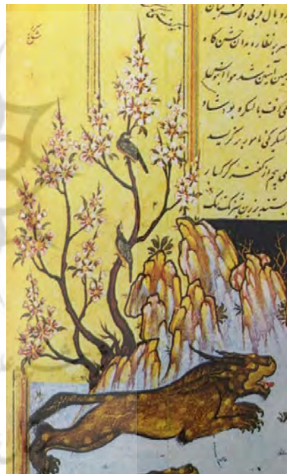
تصویر ۷- شاهنامه شاه اسماعیل دوم، قزوین ۹۸۴ (آزند، ۱۳۸۴: ۱۷۰)

تاریخی و سبک‌شناسی هنرمندان عصر شاه عباس اول و شاه عباس دوم با تاریخ ساخت و توسعه کاخ چهل‌ستون منطبق است. دو گروه دیگر از محدوده زمانی این نقاشی‌ها خارج هستند. آثار و منابع درباره این نگارگران می‌توانند در سبک‌شناسی این دیوارنگاره‌ها بسیار کارگشا باشند مثلاً همه آثار به جامانده از صادق بیگ، مهارت و استادی او را در شبیه‌سازی و تصویر کردن پرندگان و جانوران نشان می‌دهد که با قلمی لطیف و نازک کار شده و در تجسم بخشی به مناظر کوه و دشت و دمن ابتکاراتی داشته است (شاد