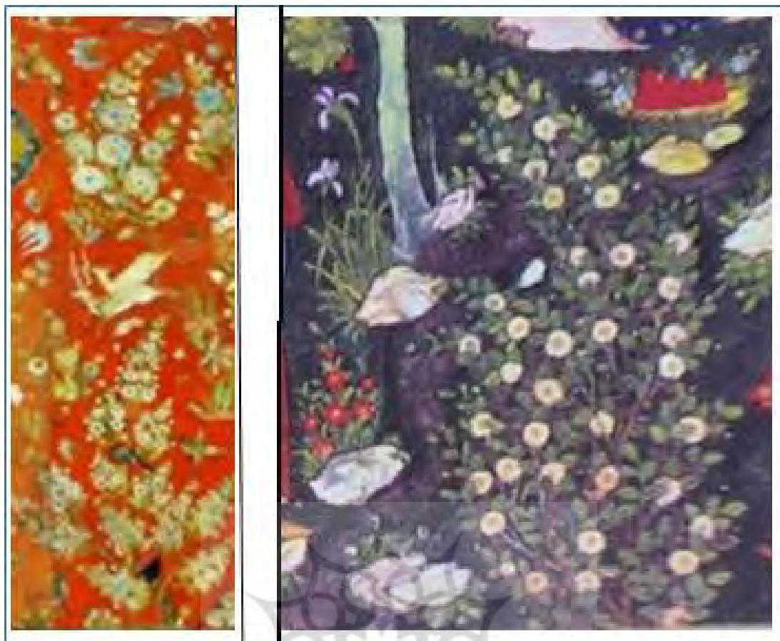
تصویر ۱۶- نقوش بوته‌ای در دیوارنگاره چهل ستون اصفهان