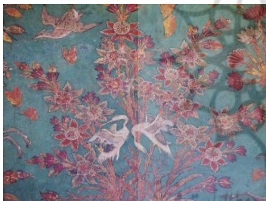
تصویر ۱۴- بوته، جزئی از دیوارنگاره چهل ستون اصفهان