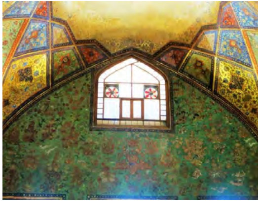
تصویر ۸-۹- نقوش جانوری (حیوانات و پرندگان) همراه با نقوش گیاهی به کاررفته در کاخ چهل ستون اصفهان