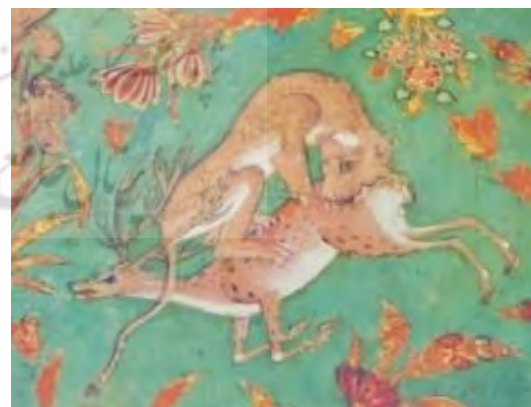
تصویر ۱۰- نقوش گرفت و گیر در کاخ چهل ستون اصفهان

نقوش گیاهی برای مقرنس‌ها و گیاهانی چون درخت‌های شکوفه‌دار و بوته‌های گل و برگ‌دار برای منظره‌سازی در دو