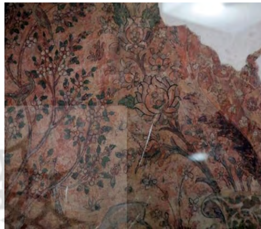
تصویر ۱۲- جزئی از دیوارنگاره چهل ستون قزوین

تفاوت آن‌ها جای پنجره‌هایی است که در داخل کادر این نقاشی‌ها قرار گرفتند. از اظهارات، آقاچانی، از مرمت‌گران و پژوهشگران کاخ چهل ستون این‌گونه به نظر می‌رسد که قبل از تغییر فرم پنجره‌ها در تالار مرکزی، پنجره‌ها در وسط هر یک از قاب‌های دیوارنگاره قرار داشته، نقوش تزیینی جانوری مورد بحث این مقاله تا پایین این دیوار ادامه داشته، سپس جای پنجره‌ها (برداشتن پنجره از وسط و کشیدن دیوار