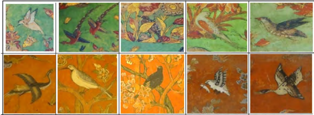
تصویر ۱۱- نقوش پرندگان به کاررفته در تالار مرکزی کاخ چهل ستون اصفهان