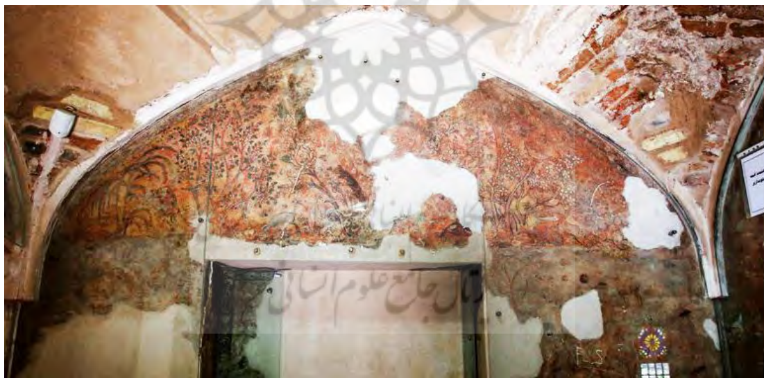
تصویر ۳- حیوانات در یک منظره طبیعی و گل‌های ختایی، چهل ستون قزوین، صفوی (میراث فرهنگی قزوین)

تزیینات با نقش حیواناتی مانند شیر، گوزن، گاو، غزال، روباه، عقاب، باز، شاهین، تذرو، کبک، سراج، بط، کلنگی، قرقاول، سیمرغ، بلبل، قُمّری، آهو و سایر طیور و وحوش (تصویر ۳): صحنه‌های نقاشی همچون صحنه‌های عاشقانه، بزم و رزم، شکار و مجالسی از اشعار نظامی گنجوی؛