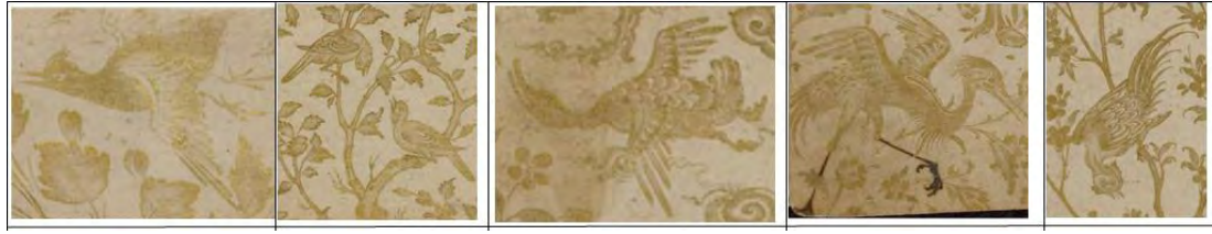
تصویر ۴- نقوش پرنندگان به کار رفته در تشعب و نگاره های خمسه ی نظامی در مکتب تبریز (URL1).