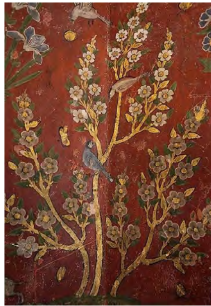
تصویر ۶- هشت بهشت اصفهان (نگارندگان)

نقوش جانوری شبیه تشعیرها و نگاره‌های مکتب تبریز و قزوین در چهل‌ستون اصفهان در تالار مرکزی جای گرفته‌اند که شامل صحنه‌های گرفت و گیر، انواع حیوانات، پرندگان و پروانه در طبیعت و عناصر تذهیب شامل ترنج است. نقوش گرفت و گیر در نگاره‌ها و تشعیرهای مکاتب تبریز به وفور و در قزوین کمتر یافت می‌شوند؛ اما در کل دو دیوارنگاره جانوری کاخ چهل‌ستون اصفهان فقط به یک مورد برخورد می‌شود.