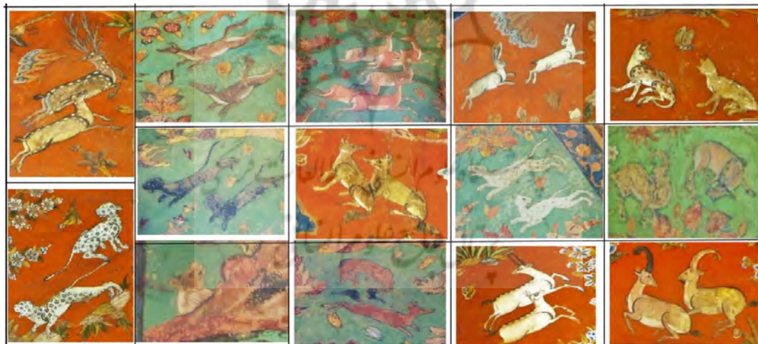
تصویر ۱۷- نقوش حیوانی به کاررفته در دیوارنگاره‌های تالار مرکزی کاخ چهل ستون اصفهان (نگارندگان)

نقاشی شده‌اند. بوته‌ها از نظر اندازه بسیار بزرگ کار شدند به طوری که جانوران در کنار آنها خیلی کوچک به نظر می‌رسند.