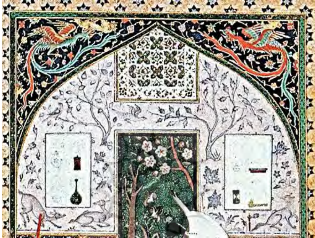
تصویر ۵- خمسه نظامی شاه تهماسب (URL1).

باتوجه به سبک دیوارنگاره های مورد نظر دو گروه به طور عمده قابل توجه هستند. ۱- هنرمندانی که زمان تولد آن ها حدوداً از دهه ی چهارم قرن دهم هجری آغاز می شود و اوج فعالیت شان مربوط به نیمه دوم قرن دهم و نیمه اول قرن یازدهم هجری، به ویژه اوج حاکمیت شاه عباس اول در اصفهان است مانند سیاوش گرجی، صادق بیگ و رضا عباسی.