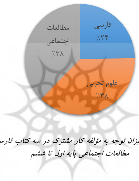
نمودار شماره ۲: مقایسه میزان توجه به مؤلفه کار مشترک در سه کتاب فارسی، علوم تجربی و مطالعات اجتماعی پایه اول تا ششم

نمودار (۲) میزان توجه به مؤلفه کار مشترک در محتوای سه کتاب فارسی، علوم تجربی و مطالعات اجتماعی را با یکدیگر مقایسه کرده است. همان‌طور که در نمودار نیز نشان داده شده است، ۲۴ درصد از فراوانی‌های مشاهده‌شده این متغیر در کتاب فارسی بوده و ۷۶ درصد باقی‌مانده نیز به‌طور مساوی در دو کتاب علوم تجربی و مطالعات اجتماعی گنجانده شده است (هریک ۳۸ درصد).