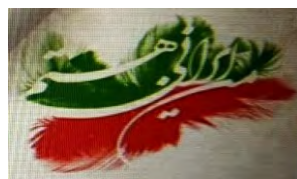
تصویر ۵: تبلیغات انتخاباتی در فضای مجازی (سایت جامعه خبری تحلیلی الف، ۱۴۰۰)

در این تبلیغ کلمه «میزان» به رنگ قرمز، «رأی ملت» به رنگ سفید و «است» به رنگ سبز است. هم‌نشینی این نوشتار با نشانه اثرانگشت و پرچم جمهوری اسلامی، معناپردازی تبلیغ را تکامل می‌بخشد. روابط هم‌نشینی غالب با روابطی زنجیره‌ای و دارای توالی زمانی است اما می‌توان از روابط هم‌نشین مکانی نیز سخن گفت که ناظر بر بالا یا پایین، چپ و راست