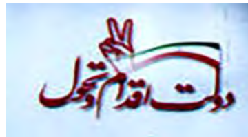
تصویر ۶ (راست): جزئی از تبلیغات انتخاباتی در فضای شهری