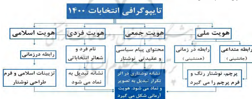
نمودار شماره ۱: الگوی تحلیلی نوشته‌نگاری انتخابات ۱۴۰۰ (نگارندگان، ۱۴۰۰)

نمودار ۱، الگوی تحلیلی پژوهش حاضر را نشان می‌دهد که در آن نوشته‌نگاری از طریق فرم و محتوای زبانی هویت ملی، اسلامی، فردی و جمعی را بیان می‌کند. این بیان مرهون حضور نشانه‌ها و کدهای زبانی و دیداری است که به شکل صریح و پنهان در بیان هویت اثر گذارند.