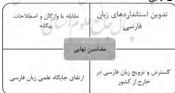
شکل شماره ۲: مضمون‌های نهایی