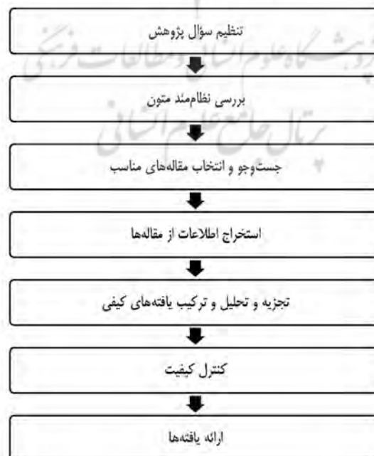
شکل ۱: روش هفت مرحله‌ای سندلوسکی و باروسو

مشهور است. علاوه بر این که اکثر بازدیدکنندگان از بسیاری از جنبه‌های رویداد راضی بودند و تقریباً تمام انتظاراتشان برآورده شد. با این حال بازدیدکنندگان از برخی جنبه‌های رویداد مانند اطلاعات درمورد رویداد، بهبود سالانه رویداد و علامت‌گذاری در داخل و اطراف محل برگزاری راضی نیستند و این جنبه‌ها به‌منزله بخشی از راهبردهای بازاریابی برای احیای رویداد مؤثر است. علی و همکاران (۲۰۱۹) در پژوهشی تحت عنوان «عوامل مؤثر بر رضایت گردشگران و وفاداری و تبلیغات دهان به دهان در انتخاب غذاهای محلی در پاکستان» به مطالعه پرداختند. به این منظور، پیمایشی با مشارکت ۲۸۶ نفر از گردشگران در کشور پاکستان انجام شد. یافته‌های پژوهش آن‌ها نشان می‌دهد که کیفیت مواد غذایی، کیفیت محیط زیست درک‌شده، ارزش درک‌شده و کیفیت خدمات تأثیر معناداری در رضایت گردشگران دارد. با این حال، کیفیت تعامل بین‌فردی تأثیر ناچیزی در رضایت نشان می‌دهد. با توجه به این که در ایران با وجود بهره‌مندی از تنوع مواد غذایی محلی و سنتی به گردشگری غذا توجه چندانی نشده و تاجایی که پژوهشگر بررسی کرده، تحقیقات انجام‌شده در کشور بسیار اندک است؛ رشد و توسعه این بخش می‌تواند در حرکت، پویایی و توسعه همه‌جانبه و پایدار کشور و جوامع شهری نقش مؤثری ایفا کند. با توجه به اهمیت موضوع و نقش بسیار مهم صنعت گردشگری غذا در کشور، در پژوهش حاضر تلاش خواهد شد عوامل مدنظر در سطح بین‌الملل استخراج و شناسایی