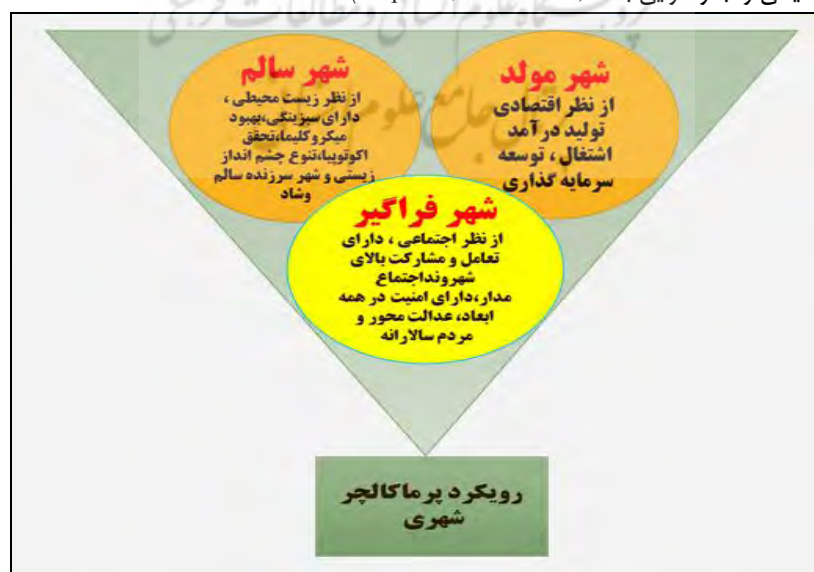
شکل ۱- رویکرد پرماکلچر شهری، ماخذ: نگارنده، ۱۴۰۰.