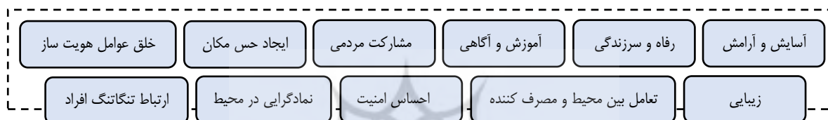
نمودار ۱- مؤلفه‌های مورد توجه در طراحی مراکز فرهنگی در راستای توجه به پایداری اجتماعی (منبع: مطالعات نویسندگان، ۱۴۰۰).

با توجه به مطالب مطرح شده و تعاریف پایداری اجتماعی می‌توان معیارهای و تأثیرات توجه به رویکرد ارتقاء پایداری اجتماعی در طراحی مرکز فرهنگ را به صورت زیر بیان کرد و آن‌ها را با مبنای معماری و ارائه راهکار در طراحی در جدول شماره ۳ طبقه‌بندی کرد: