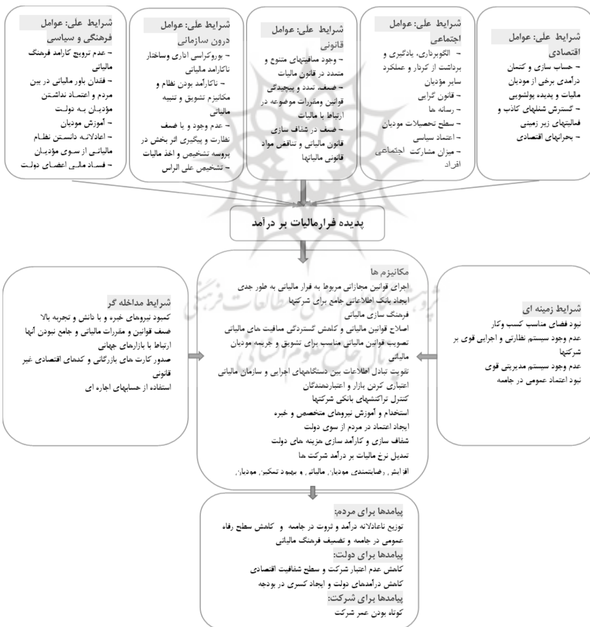
شکل ۲. مدل جامع پدیده فرار مالیاتی بر پایه مالیات بر درآمد (مأخذ: یافته‌های پژوهش)

مسئله فرار مالیاتی از دهه‌های گذشته توجه محققان و سیاست‌گذاران را جلب نموده و مطالعات مختلفی در این خصوص صورت پذیرفته است. بر این اساس، ارائه مدل