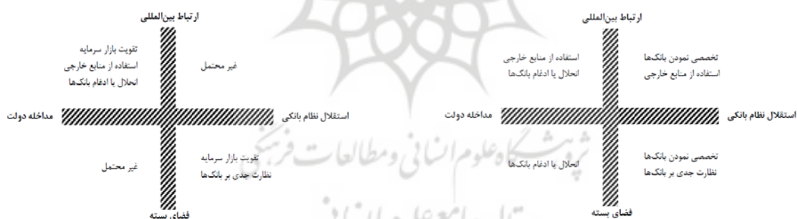
شکل ۲. تمایل متقاضیان منابع مالی به راهکارهای غیر بانکی

- سه تکنولوژی هوشمند و دیجیتالی که در حال تغییر است و جهانی‌شدن استانداردهای افشاء و گزارشگری، و