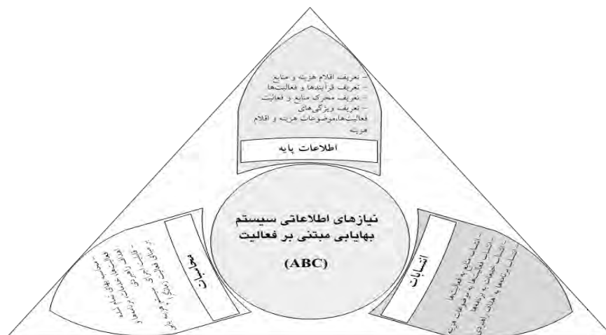
جدول (۶). توانمندی های لازم در استقرار سیستم ABC

حمایت و پشتیبانی سیستم‌های نرم‌افزاری موجود در سازمان دارد تا از این مسیر، داده‌های (مالی و عملیاتی) مورد نیاز این سیستم فراهم شود. با توجه به بررسی‌های صورت گرفته و شناخت کسب شده از نرم‌افزارهای دانشگاه‌های علوم پزشکی، لازم است اصلاحات مورد نیاز در ساختار نرم‌افزارها به منظور یکپارچگی آنها جهت تأمین داده‌های سیستم بهایابی مبتنی بر فعالیت صورت پذیرد. همچنین از نرم‌افزارهای پشتیبان موجود در سازمان از قبیل سیستم اطلاعات بیمارستان بهره‌گیری کافی به عمل آورده و ظرفیت‌های گزارش‌گیری از این نرم‌افزار جهت تأمین داده‌های مالی و عملیاتی (محرک منابع و فعالیت) ایجاد گردد.