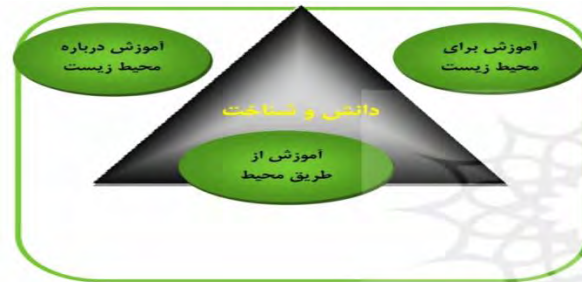
شکل 1. اجزا به پیوسته عناصر آموزش محیط‌زیست

درباره برنامه‌ریزی برای آموزش و یادگیری به وجود می‌آورند که بازتابی از ساختار سه‌گانه آموزش و محیط‌زیست و انتظارات موجود از آن خواهد بود. این ساختار سه‌گانه عبارت است از: ۱. آموزش درباره محیط‌زیست (دانش و فهم) ۲. آموزش از طریق محیط‌زیست (مهارت)، ۳. آموزش برای محیط‌زیست (نگرش) (Palmer, ۴۴۴۴).