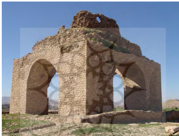
تصویر ۲- چهارطاقی خیر آباد در خوزستان

۴-۱-۳- چهارطاقی " در معماری به کالبدی با زمینه چهارگوش و پوشش گنبدی، متشکل از چهار پایه و یک طاق گنبدی بر روی آن، با چهار ورودی طاق دار، گفته می‌شود. چهارطاقی را چهار در یا چهار قاپو و چهاردروازه نیز نامیده‌اند. نمونه‌هایی از چهارطاقی در فیروزآباد(گور)، باکو، فراشبند، جره، نطنز، کازرون، آتشکوه، نیاسر(متعلق به دوره اردشیر اول ساسانی) و... باقی مانده‌است. بیشتر چهارطاقی‌های مذکور، وابسته به آتشکده‌ها و محل استقرار آتش و اجرای مراسم دینی و سایبان دائم برای آتش بودند". (گذار و دیگران، ۱۳۶۵: ۱۶) "در دوره اسلامی برخی از چهارطاقی‌ها به مسجد یا امام‌زاده تبدیل شده‌اند. از این طرح‌ها به سبب قابلیت‌های بسیاری در فضا سازی، در گستره زمانی و مکانی و در بناهای مذهبی و غیر مذهبی استفاده شده‌است". (گذار و دیگران، ۱۳۶۵: ۱۷)