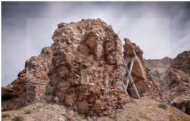
تصوی ۵- آتشکده آذر برزین مهر خراسان .

" قوس جبهه شمالی چهارطاقی، تقریباً سالم و بدون فروریختگی است و از لحاظ فرم و تکنیک چیدن سنگ‌ها به طاق نماهای نعلی شکل بناهای هم عصر خود نظیر دروازه‌های شمال و جنوب تخت سلیمان شبیه‌است؛ ولی در ابعاد و شکوه مانند آن نیست. این بنا در وضعیت موجود ۷ متر بلندی دارد و به دلیل ریزش آوار سقف، نمی‌توان اندازه دقیق و اولیه و ارتفاع گنبد را سنجید. مصالح بنا کلاً از سنگ‌لاشه است که از ارتفاعات اطراف بنا تهیه شده‌است." (Erdmanne, 1969).