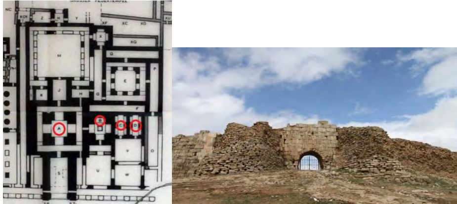
تصویر ۳- باقی مانده آتشکده آذرگشنسب. پلان ۴ آتشکده آذرگشنسب (سلیمی، ۱۳۹۴: ۷۳)