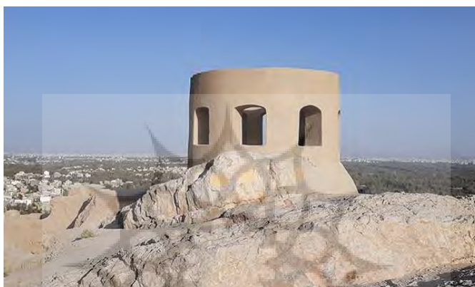
تصویر ۱- آتشگاه اصفهان ۵

محققان در پی تحقیقاتشان به این نکته دست یافتند که چرا آتشگاه‌ها از آتشکده‌ها فاصله داشتند؟ یافته آنها این بود؛ که محل آتشکده باید در مرتفع‌ترین و پاک‌ترین نقطه و مکان آتشگاه در نزدیکی رودخانه باشد. ممکن است انتخاب محل آتشگاه در مجاورت آب که آتشکده بستگی مخصوصی به آن دارد از لحاظ سهولت به دست آوردن آن باشد نه الزام مذهبی. با وجود اینکه «استرابن» ۴ می‌گوید: «ایرانی‌ها با شکوه‌ترین قربانی‌های خود را نسبت به آب و آتش به جا می‌آوردند».