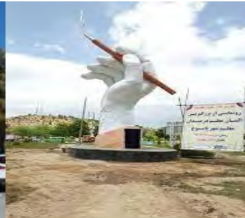
شکل (۱۰): میدان معلم