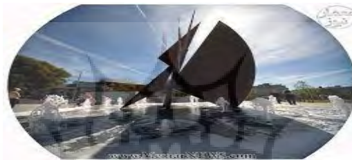
شکل (۱): میدان e'yre در پارک شهر مادرید (اسپانیا)

المانهای نمایشی همانگونه که از اسمشان بر میآید صرفاً جنبه ی نمایشی - هنری و زیبایی دارند - مفهوم خاصی را اصولاً بیان نمیکند و هدف و رسالتی برای القاء مطلبی به بیننده و یا انتقال پیامی ب وی را ندارند. ترکیباتی هستند انتزاعی از برخورد توده ها - احجام - اجزاء سازه ای و صفحات (به نوعی بازی با خط و حجم و صفحه با توجه به ویژگی های هندسی و روابط درونی آنها) که تنها به لحاظ ویژگی های زیبایی شناسانه و تعادل بصری و هنری میتوانند با گروهی خاص از انسانها ارتباط برقرار کنند. این خاص بودن مخاطب از ویژگی های منحصر به فرد یک المان نمایشی میباشد. یعنی در هر مخاطبی احساس تعلق و تامل را بوجود نمی آورد لذا به دلیل نوع مخاطبین آن که طبعاً افرادی هستند که بیشتر درگیر مسائل هنریند و تعادلها و نظامهای هندسی را میشناسند و در مورد سبکهای هنری و هنر مفهومی و انتزاعی مطالعه دارند اینگونه المانها در سطح شهر ها کمتر دیده میشوند و مکان استقرار آنها نیز طبعاً گالریهای هنری - نمایشگاههای آثار هنری و به طور کلی مکانهایی میباشد که مخاطب خود را پیدا کنند.