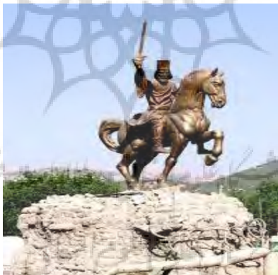
شکل (۱۲): آریوبرزن

اما در مجموع المان هایی که در شهر یاسوج تاکنون طراحی شده یا بی محتوا بوده یا جا نمایی اشتباهی داشته اند و یا بدون توجه به محیط اطرافشان طراحی شده اند.