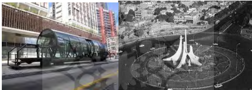
شکل (۲): میدان ضد مشهد (در حال حاضر تخریب شده) شکل (۳) نمونه ی ایستگاه اتوبوس (curtiba - برزیل)

ها میباشد. چرا که عنصر عملکرد ایجاد میکند در هر مکانیکه نیاز به موضوع مورد نظر باشد نمونه ای از آن وجود داشته باشد به طور مثال ایستگاههای اتوبوس، مترو، کیوسکهای تلفن، دکه های روزنامه فروشی، سردرها و مکانهای خدمات و اطلاع رسانی در سطح شهر ها و همچنین انواع چراغها و تاسیسات خاص شهری در صورتیکه موارد فوق دارای طراحی قوی، منحصر به فرد، شاخص و با استفاده از اجزاء و نظامهای هندسی و بصری که پیشتر ذکر آن رفت توسط متخصصین و هنرمندان ساخته شوند و ویژگیهای بصری و هنری باز هم اولین عامل در بازشناسی یک اثر ماندگار است. در صورتیکه یک سازه ی عملکردی دارای زیبایی و نظام هنری باشد میتواند برای هر شهر به سبک خود طراحی شده و با سایر شهرها متفاوت باشد (مثلا بگوئیم در فلان شهر ایستگاههای اتوبوس یا دکه های روزنامه فروشی به این شکل ساخته شده اند و این خود یکی از ویژگی ها و شاخصه های آن شهر میشود) از این نظر و به دلیل گستردگی تعداد المانهای عملکردی در سطح شهرها و سطح وسیعتری از مخاطبین که پوشش میدهند میتوانند نشان از اهمیت و موقعیت خاص این نوع از المانها داشته و مسئولیت دقت نظر بیشتری را از متولیان زیبا سازی و برنامه ریزی شهرها میطلبد. مکان قرار گیری این نوع المانها در سطح شهرها و هر جا که انتظار کار بری مورد نظر میرود میباشد و متناوبا به چشم میخورند.