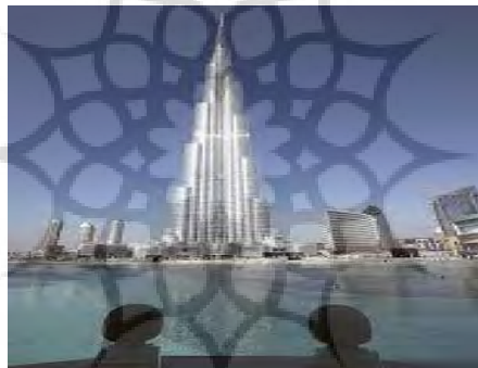
شکل (۷): برج خلیفه یا برج العرب

اما این برج خلیفه که قرار بود نماد دوبی باشد، یادمان چیست؟ آیا واقعاً توانسته نخستین نشانه ذهنی از این امیرنشین عربی باشد؟ آیا توانسته هم پای برج العرب که سال ها یادمان هویتی دوبی بود، تصویر خود را در ذهن هن جهانیان ثبت کند؟ دوبی حتی در دوران اوج خود شهری است که در آن زرق و برق زیاد است. هیچ نشانی از هماهنگی میان عناصر شهری در آن وجود ندارد. هویت مشترکی عناصر شهری را در این شهر به هم متصل نمی کند. هر ساختمان و هر عنصری در دوبی ساز خود را می زند. سخت می توان شباهتی میان برج العرب وبازار ابنطوله پیدا کرد. همه این سازه های فوق مدرن و پیشرفته که هزینه زیادی بابت معماری آن پرداخته شده، بیش از هر چیز یادمانی از بی هویتی این شهر است. نمادهایی چون برج العرب یا برج الخلیفه فرقی با هم نمی کنند، هر دو تداعی کننده یک حس مشترک از یکی از پرهزینه ترین و کوتاه ترین تجربه های بشری در شهرسازی جهانی اند.