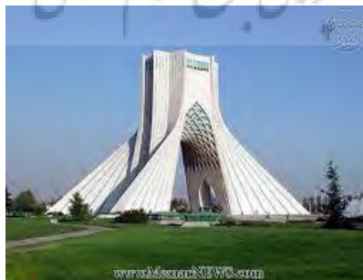
شکل (۴): میدان آزادی - شهید (تهران)

المانها میتوانند به صورت تلفیقی از دو یا حتی هر سه نوع شکل موجود باشند یعنی المانی جنبه ی نمایش، بیانی داشته باشد یا بیانی، عملکردی یا نمایشی، عملکردی و حتی مواردی نیز وجود دارد که هر سه نوع این مفاهیم در آنها به چشم میخورد! به طور مثال میدان آزادی (شهید سابق) در تهران نمونه ای از المانهای عملکردی- بیانی است که هم دارای عملکرد میباشد (موزه و فضایی زیستی برای کاربری انسان در بالای آن تعبیه شده) و هم به لحاظ بیان مفهوم آزادی طراح سعی کرده با همان فرمها و ویژگیهای هندسی و معمارانه منظور خود را در قالب انتزاع بیان کند.