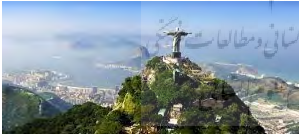
شکل (۶): دیوار مجسمه مسیح، ریودوژانیرو

وقتی صحبت از دیوار برلین می شود چنان با حرارت حرف می زنند که انگار رنج هایی که بر ایشان رفته هنوز هم ادامه دارد. شاید اگر این اتفاق در کشور دیگری به جز آلمان رخ داده بود، مردم آن کشور بعد از تخریب دیوار برلین، هر چه نشان این دیوار کدایی بود درب و داغان می کردند اما آلمانی ها نه تنها این کار را نکردند بلکه در بخش هایی از شهر، دیوار را به عنوان یادمان زمان رنج به همان شکل حفظ کردند. به طوری که الان یکی از جاذبه های توریستی برلین بقایای همین دیوار است. این را مقایسه کنید با شهری مثل تهران- یا برخی از شهرهای جنگ زده کشورمان- که امروز بعد از گذشت سال ها از زمان جنگ تحمیلی، هیچ نشانی از آن روزها در آنها باقی نمانده. شاید اگر بقایای چند ساختمانی. اگر بقایای چند ساختمانی را که به خاطر موشک باران ویران شده بود، همان طور دست نخورده بود.