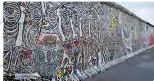
شکل (۵): دیوار برلین