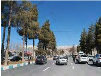
شکل (۱۱): خیابان جمهوری اسلامی