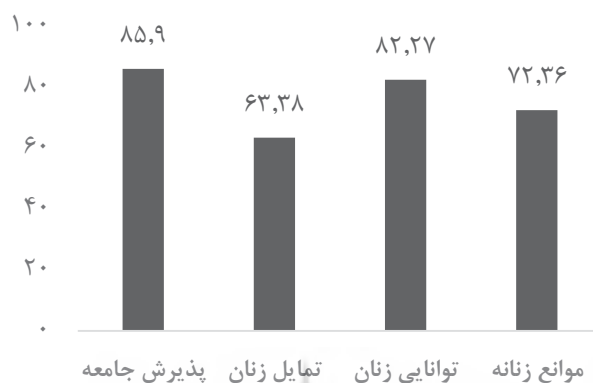
شکل ۳. امتیازات ابعاد موثر بر نگرش نسبت به تصدی پست‌های مدیریتی توسط زنان

همان‌گونه که مشاهده می‌شود عامل پذیرش عمومی جامعه نسبت به زنان بالاترین امتیاز (امتیاز ۸۵/۹۰) را کسب کرده است. پس از آن عوامل توانایی زنان (امتیاز ۸۲/۲۷)، موانع زنانه (امتیاز ۷۲/۳۶) و تمایل زنان (امتیاز ۶۳/۳۸) قرار دارند. با توجه به امتیازات کسب شده می‌توان گفت که بر اساس نگرش دانشجویان بزرگ‌ترین مسئله فراروی زنان جهت تصدی مناصب مدیریتی ابتدا پایین بودن تمایل زنان به مدیریت و سپس موانع زنانه است. به عبارتی دانشجویان نسبت به وجود تمایل در زنان و وجود یک سری موانع زنانه نگرش کلیشه‌ای تری دارند. به منظور بررسی آماری وجود تفاوت معنادار بین موانع فوق از آزمون تحلیل واریانس به شرح جدول شماره ۶ استفاده شده است.